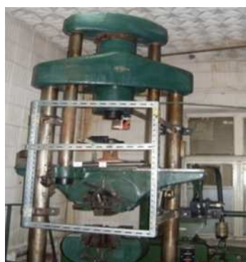
Рис. 2. Випробування прокладок ППТ і ПНТ при динамічному навантаженні