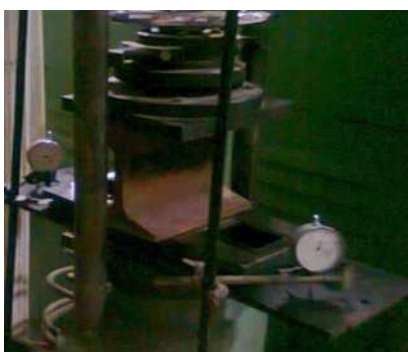
Рис. 1. Випробування на статичне навантаження прокладки ППТ і ПНТ

стискальних і зсувних сил. Співвідношення зсувних і стискальних сил задавалося зміною кута нахилу робочого майданчика.