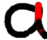
Рис. 2. Пример шаблона символа

Предлагается использовать признак повторных контуров, который позволяет проверить, присутствует ли в изображении линии, по которым производится двойное проведение пера, и их расположение относительно координат изображения, что позволяет увеличить точность распознавания символов на входящем изображении.