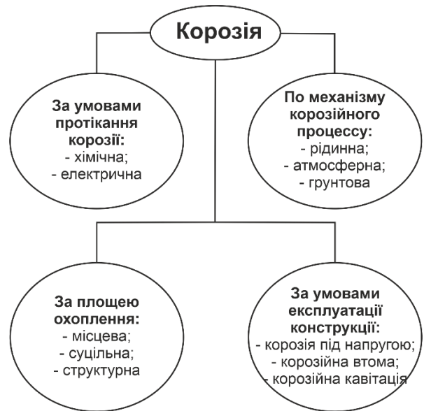
Рис. 1. Види корозії

моделі «Конструкція - агресивне середовище» обумовлено впливом перевезених корозійно-активних вантажів; моделі, обумовлені конструктивним виконанням і умовами експлуатації вагонів.