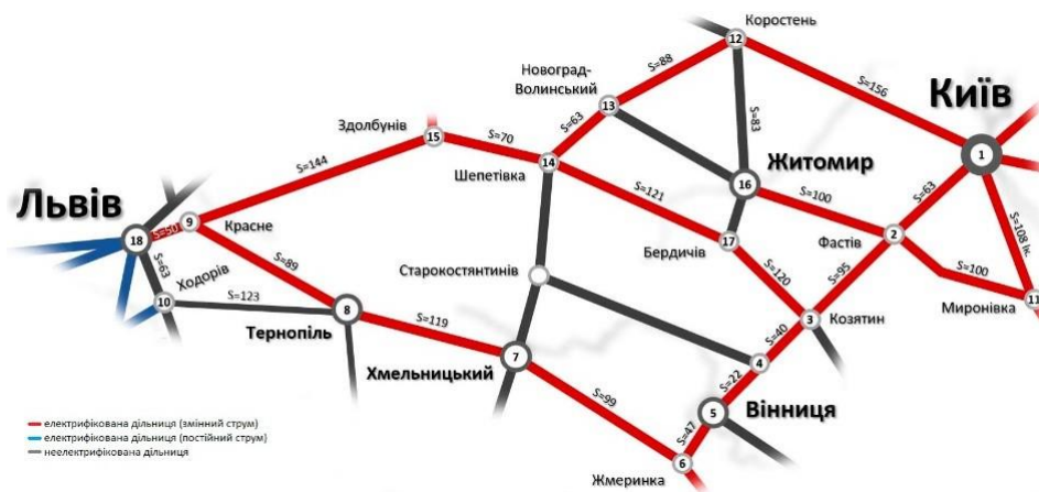
Рис. 2. Зважений граф залізничної підсистеми за напрямком перевезень Київ-Львів

Виходячи з вищевказаного, топологію напрямку перевезень подаємо як зважений граф G(I, J) , де I = I(i) – множина вершин графа (залізничні станції), J(j) – множина ребер графа (залізничні дільниці) з вагою у вигляді кортежу: j(i_k, i_{kl}) = (S_j, h_j, r_j) , де S_j – довжина дільниці; h_j – булева змінна, h_j = \begin{cases} 1 - \text{дільниця } j \text{ електрифікована,} \\ 0 - \text{дільниця } j \text{ неелектрифікована;} \end{cases} r_j – пропускна спроможність j -ї дільниці; k \in I(i) – номер вершини (станції). Як приклад на рис. 2, 3 наведено зважені графи на напрямках перевезень Київ-Львів, Київ-Одеса.