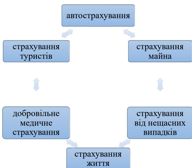
Рис. 3. Пріоритетні напрями розвитку страхового ринку України за 2018–2019 рр.

Загальна проблема страхових компаній практично однакова: їх більшість так і не навчилася заробляти на класичних страхових продуктах. Через високі витрати на андеррайтинг та комісійні агентам (від 30% до 50%) збитковість обов'язкового страхування авто-цивільної відповідальності сягає 120–150%. Схожа проблема спостерігається за іншими видами страхування. Заробіток великих компаній переважно засновується на страхуванні КАСКО, якщо вони мають стабільну базу клієнтів та не демпінгують.