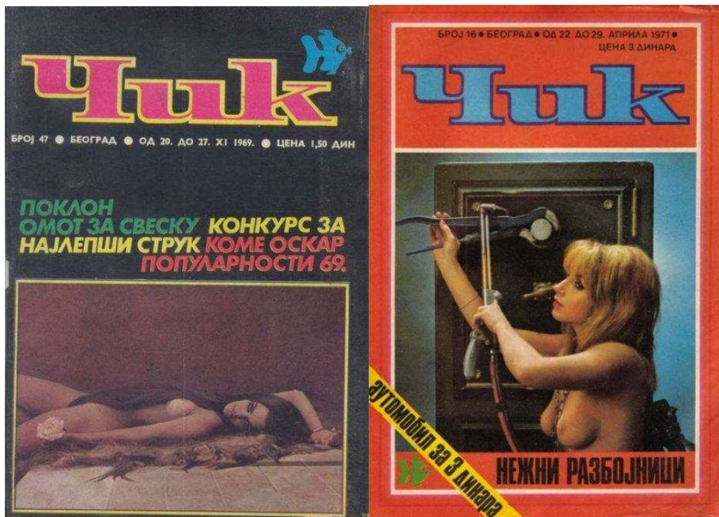
Рис. 2. Обкладинки югославського журналу «Чик» за 1969 та 1971 роки [16; 17]

Югославія не дуже прославилась легендарними фільмами, але також внесла свою частинку в сексуальну емансипацію жінки. 1969 рік: поки весь Союз радіє появі туалетного паперу в магазинах, в Югославії виходить перший випуск еротичного журналу «Чик» (рис. 2). Відверті фотосесії, перші статті з сексуальної освіти тощо. Контрабандою ці журнали возились у Радянський Союз разом зі взуттям та іншими бажаними предметами споживання.