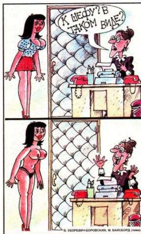
Рис. 4. Карикатура з журналу «Крокодил» [8]