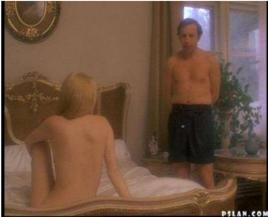
Рис. 1. Кадр з фільму «Секс-місія» (1983)

Але не Угорщиною єдиною. Польща «грішила» оголеними пані в кінематографі ще з 60-х років. У 1974 році режисер Анджей Вайда знімає фільм «Земля обітована». Фільм має кілька сюрпризів: еротичні сцени, серед яких є навіть зображення оргії. Це було не іграшкою для чоловіків, це було справжнім бунтом. В інтерв'ю 2004 року режисер зазначає, що він «... нещодавно зробив нову версію картини «Земля обітована», з якої вирізав дві еротичні сцени. Я соромився їх 20 років. Чому я їх зняв? Тому, що цензура забороняла нам знімати еротичку, ми бились за свободу будь-якими шляхами. Можливо, зараз це може здатись чимось дитячим, але тоді це так не здавалось...». У 1983 році також відзначився режисер Юліуш Махульський. Його картина «Секс-місія» для совецького глядача була перейменована на «Нових амазонок», більше того, з фільму вирізали двадцять п'ять хвилин еротичних сцен (рис. 1).