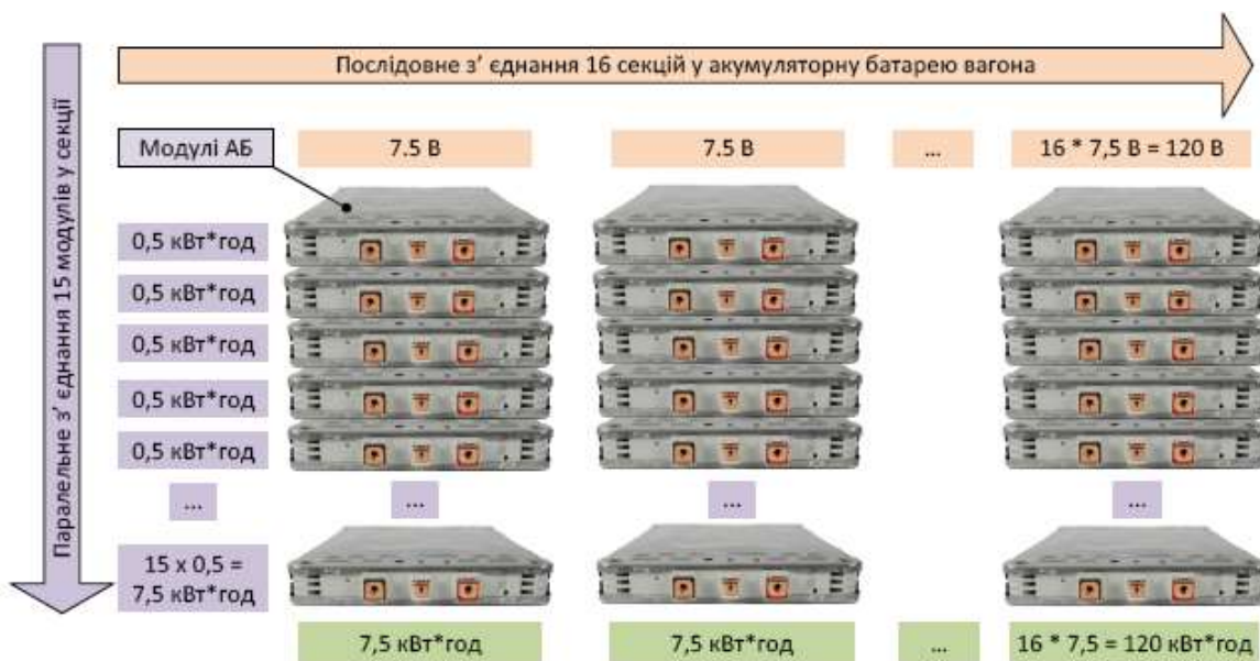
Рис. Визначення кількості модулів у літій-іонній батареї вагона