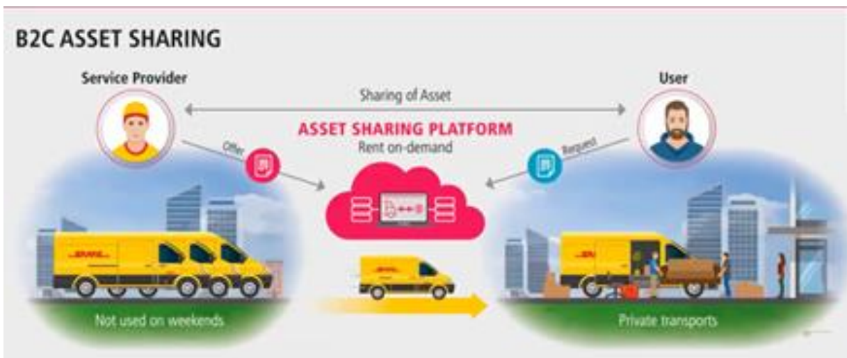
Рисунок 3 – Процес реалізації технології B2C Asset Sharing компанії DHL

Також компанія DHL впровадила технологію B2C Asset Sharing – це бізнес-модель, у якій логістична компанія надає свої транспортні засоби приватним особам у момент, коли вона їх не використовує, або у момент, коли більш вигідно здати транспортні засоби в оренду контрагенту, а для своєї компанії – купити на ринку послугу перевезення (рис. 3) [1].