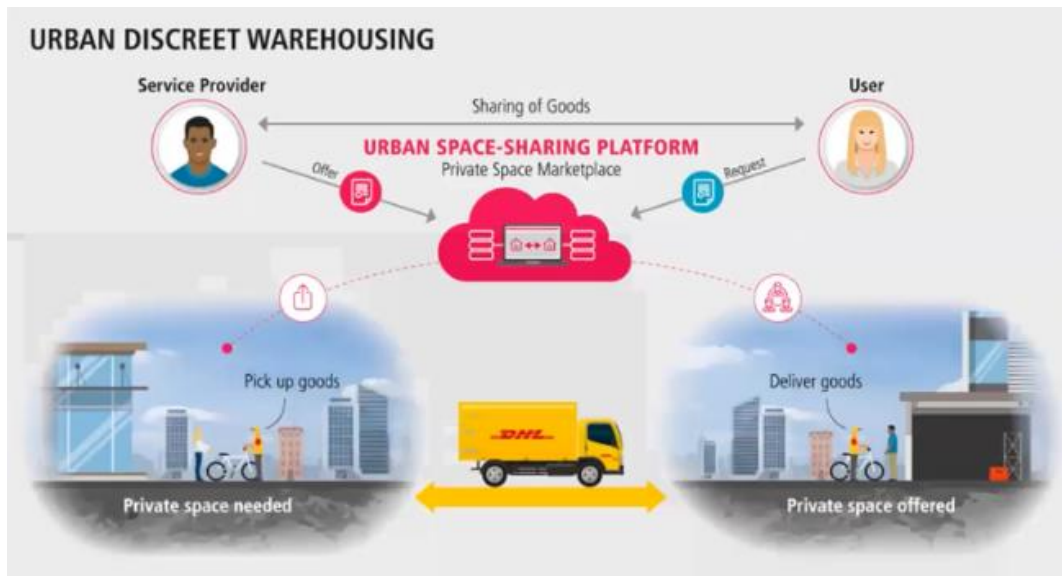
Рисунок 1 – Процес реалізації технології Urban Discreet Warehousing

приїзжає до власника велосипеда, робить «паспорт» і фото велосипеда, доставляє його на зберігання до другої людини, і отримує за це свою транзакцію (рис. 1). Таким чином компанія DHL вирішила ще одну проблему на ринку.