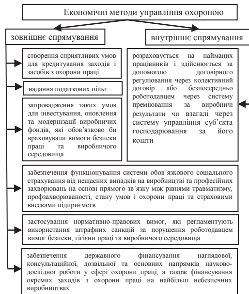
Рис. 1 – Зовнішні та внутрішні економічні методи управління охороною праці (узагальнено [3,4,6])

управляють, поділяються на методи зовнішнього та внутрішнього спрямування (рис.1).