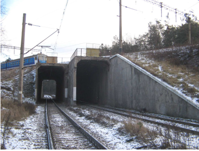
Рис.1 – Железобетонный путепровод тоннельного типа на 837 км участка Нежин – Киев Юго-Западной железной дороги, электрифицированного переменным током

зии, отслоение защитного слоя и сильная коррозия арматуры в зоне контактных проводов. Характерным является также наведение постоянных электрических потенциалов на различных участках конструкции, хотя напряжение в контактном проводе является переменным.