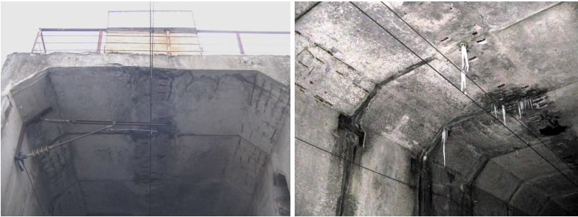
Рис.2 – Характерные повреждения железобетонных конструкций путепровода тоннельного типа в зоне контактных проводов