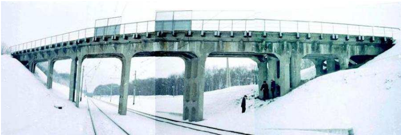
Рис.3 – Железобетонный путепровод на 802 км участка Гребенка – Черкассы Южной железной дороги (2004 г.). Под путепроводом проходят электрифицированные переменным током железнодорожные пути