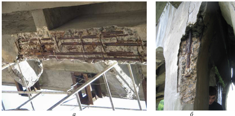
Рис.4 – Разрушенный защитный слой и коррозия арматуры в балке пролетного строения (а) и разрушенная вута и коррозия арматуры в ней (б)

Работы, посвященные исследованию и раскрытию механизма коррозии арматуры в бетоне от действия переменного тока, практически отсутствуют, в отличие от работ по коррозии металлов и арматуры от постоянного тока. Имеющиеся работы носят описательный характер и базируются на применении обычных представлений электрофизики и электротехники с представлением бетона как проводника с активным сопротивлением.