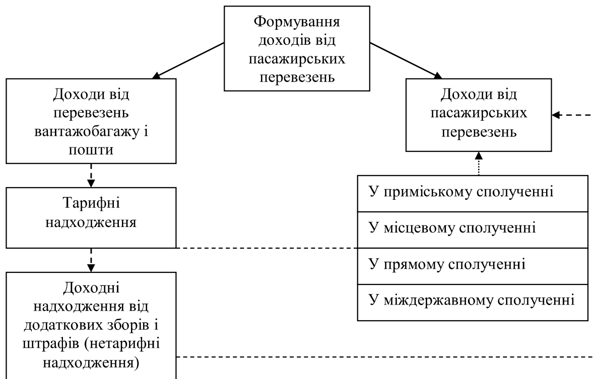
Рис. 1. Формування доходів від пасажирських перевезень

Доходи від основної діяльності – найважливіший показник, темп росту якого характеризує ступінь зростання економічної ефективності виробництва. Формування доходів від пасажирських перевезень представлено на рисунку 1.