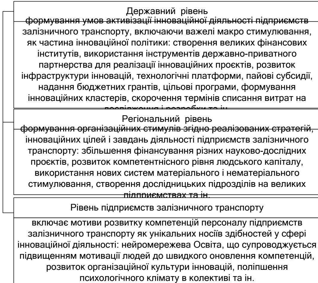
Рис. 1. Розподіл сучасних інструментів активізації інноваційної діяльності підприємств залізничного транспорту за рівнями управління (розробка авторів)

Тобто, наявні особливості господарювання підприємств залізничного транспорту, а також велика кількість існуючих наукових досліджень у даному напрямку [7-9] дозволяють говорити про багаторівневість системи інноваційної діяльності, в якій доцільно виділити три рівні і відповідні їм сучасні способи активізації інноваційної діяльності (рис. 1).