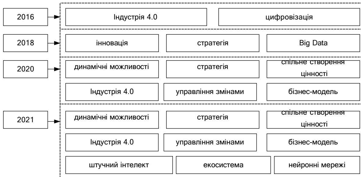
Рис. 3. Зміна тематичних складових цифрової трансформації бізнесу

Як показано на рис. 3, 2019 рік став роком значного збільшення у публікаціях, присвячених цифровим трансформаціям. Не дивно, що досліджувані теми стали більш різноманітними. Основними ключовими словами в 2020 році були динамічні можливості і стратегія (по шість статей в кожній з 63 статей), Індустрія 4.0 і спільне створення цінності (по п'ять статей в кожній з 63 статті), створення цінності та великі дані (по чотири статті в кожній з 63 статей) і зміни менеджмент і бізнес-модель (по три статті в кожній з 63 статей в цілому).