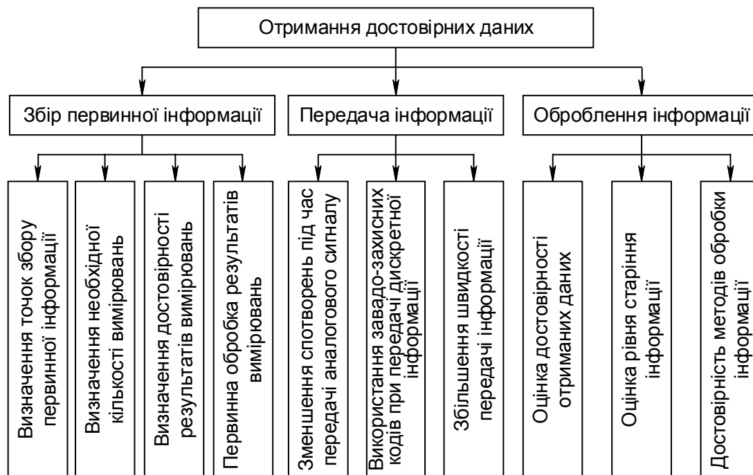
Рис. 3. Складові отримання інформації про об'єкти технічного контролю