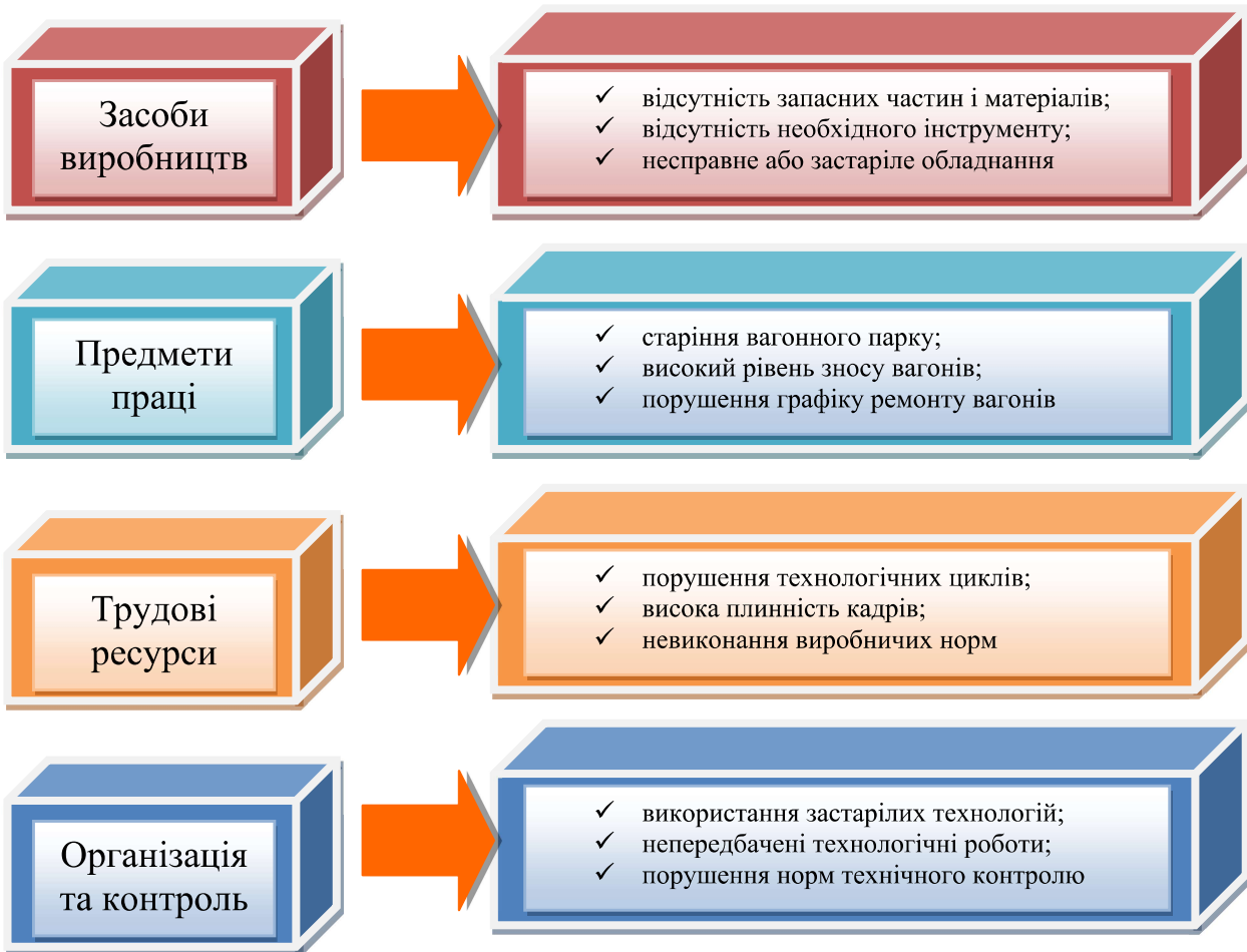
Рисунок 1 – Основні фактори, що впливають на поточний стан виробничої системи вагоноремонтних підприємств

Логістичне управління в промисловості найчастіше використовують у вигляді комплексу заходів для отримання сумарного ефекту від удосконалення виробничих систем, який отримав назву «бережливого виробництва». Бережливе виробництво – це концепція управління виробничою системою, яка заснована на неухильному прагненні до усунення всіх видів виробничих втрат. Бережливе виробництво припускає залучення в процес оптимізації виробництва кожного співробітника і максимальну орієнтацію на замовника.