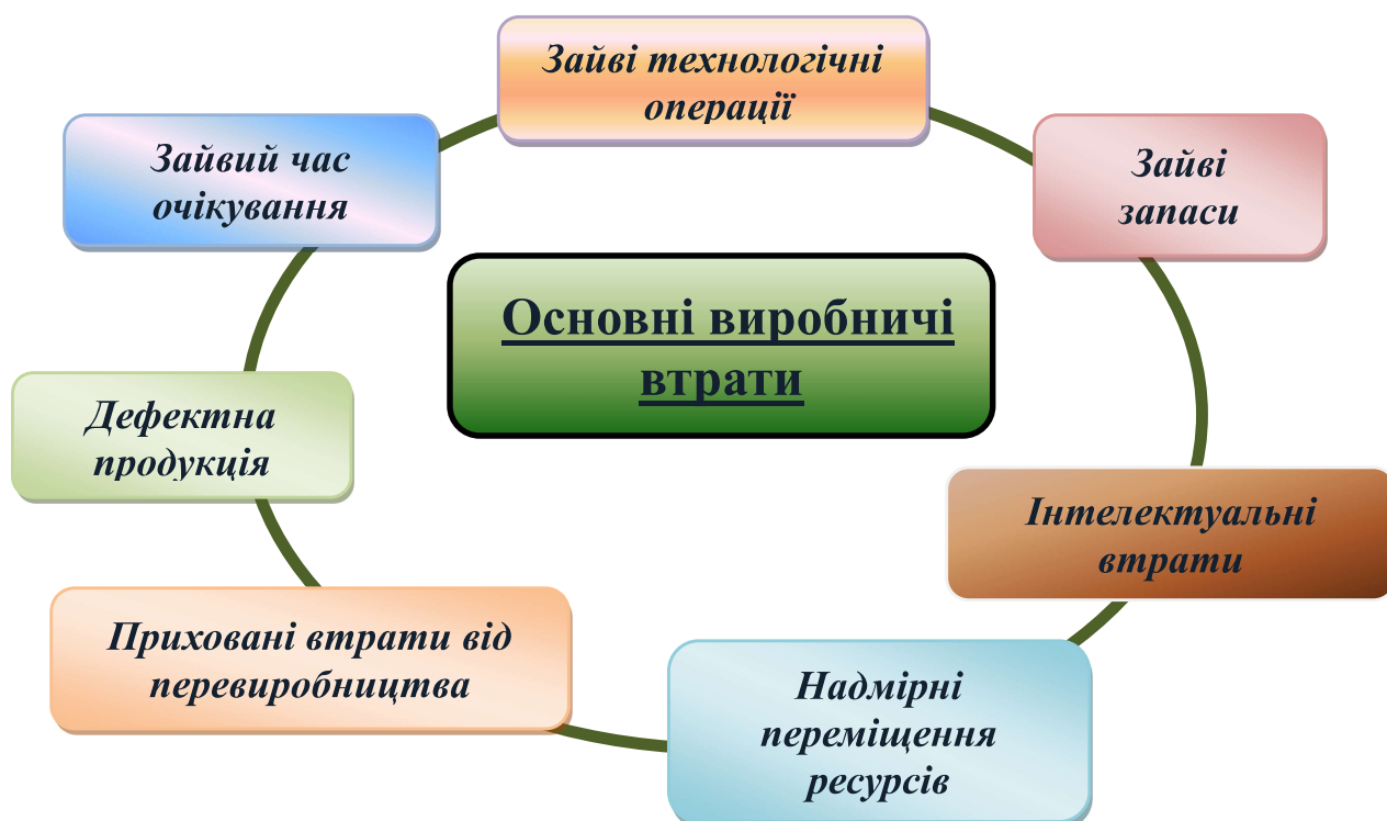
Рисунок 2 – Основні втрати виробничої системи у бережливому виробництві

знизити загальні виробничі витрати, підвищити якість продукції та знизити собівартість ремонту [4].