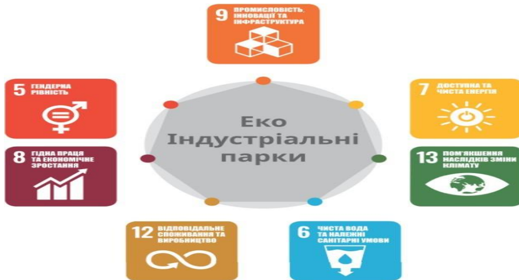
Рис.1. Ключові цілі сталого розвитку 2030, які вирішуються в системі еко-індустріальних парків [11]

Реалізація можливостей концепції еко-індустріальних парків підприємствами та іншими організаціями буде підтримуватися постачальниками послуг концепції еко-індустріальних парків, що призведе до зменшення впливу на оточуюче середовище та операційних й інших бізнесових витрат, а також до підвищення їх природно-ресурсної продуктивності. У зв'язку з чим, в рамках Глобальної програми створення еко-індустріальних парків повинні бути розроблені та здійснені спеціальні заходи щодо впровадження концепції еко-індустріальних парків на рівні країн в Колумбії, Перу, України та В'єтнаму.