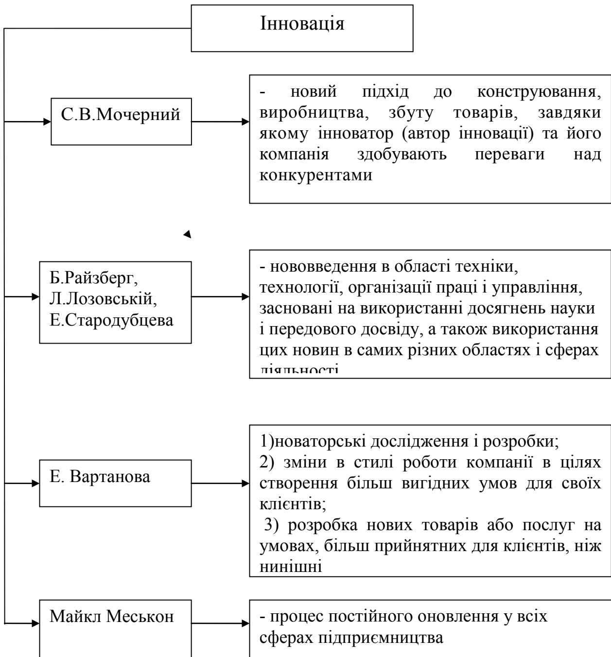
Рис.1 - Систематизація визначень поняття інновації

Узагальнивши наведені вище визначення, можна зробити висновок, що під інновацією розуміється форма прояву науково-технічного процесу, результат особливої інтелектуальної праці, пов'язаної з безперервним оновленням всіх сфер життєдіяльності.