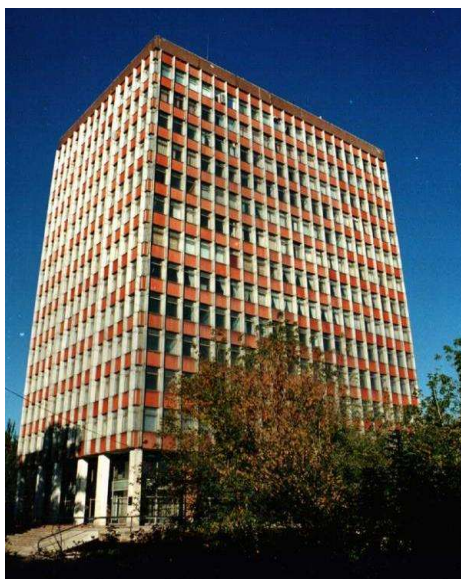
Матеріали міжнародної конференції НТУ «ХПІ»