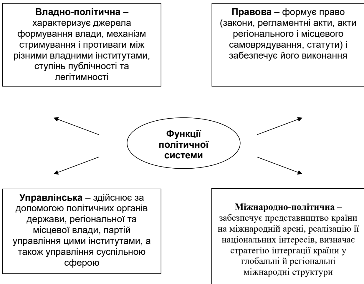
Рисунок 2 - Функції політичної системи

Політична система виконує численні функції , найголовніші з яких наведені на схемі: (рисунок 2).