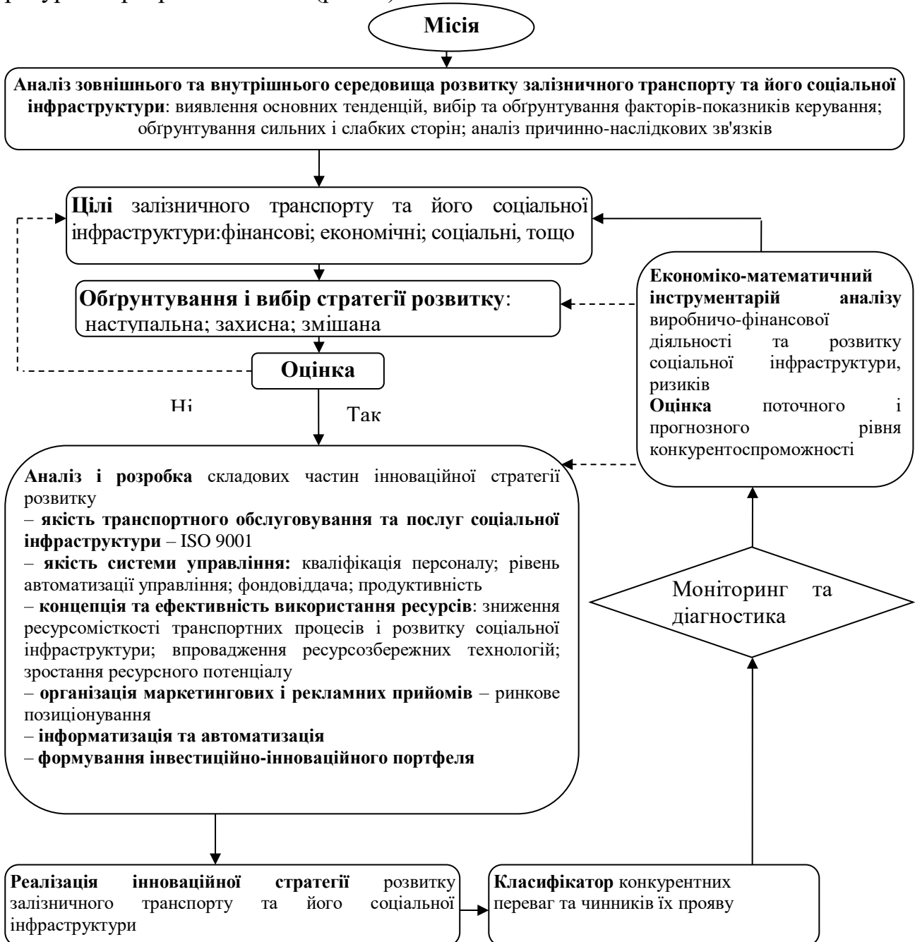
Рис. 6 Алгоритм розробки інноваційної стратегії розвитку залізничного транспорту та його соціальної інфраструктури

Пошук шляхів підвищення ефективності управління інноваціями в розвитку залізничного транспорту і його соціальної інфраструктури зумовлює необхідність розробки й реалізації конкретної інноваційної стратегії. Алгоритм розробки інноваційної стратегії розвитку залізничного транспорту та його соціальної інфраструктури, заснований на стратегічному плануванні та гнучкому бюджетуванні, як вихідну інформацію передбачає використання фактичних даних роботи галузі, нормативних і регульованих показників і обмежень. Певною мірою такий алгоритм можна назвати імітацією цільового планування, яке здійснюється за схемою «цілі – цільові програми – ресурси – ресурсні програми – план» (рис. 6).