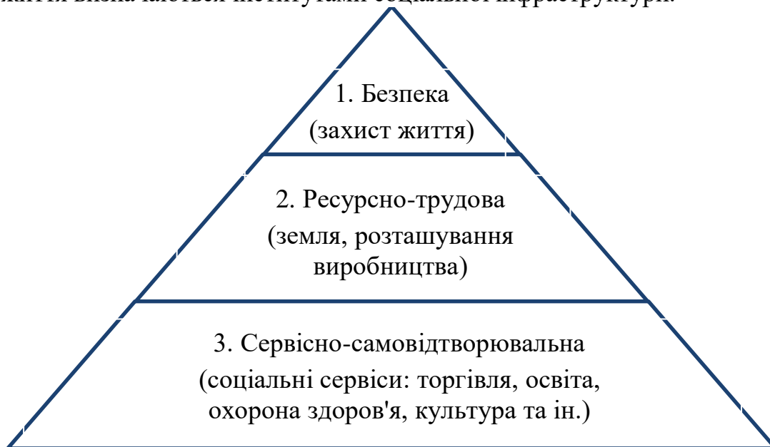
Рис. 1. Еволюція каркасоутворювальних домінант розташування місця життя населення

Оцінка еволюції ролі та місця інститутів соціальної інфраструктури в системі забезпечення соціально-економічного розвитку економіки засвідчила розширення їх функціональної орієнтації із забезпечення існування особи та суспільства на формування глобальних умов соціально-економічного розвитку, виокремила її як чинник тяжіння в розміщенні продуктивних сил, формування глобальних конкурентних переваг країн та територій. Посилення мобільності населення зумовило зростання ролі соціальної інфраструктури у виборі місця проживання на фоні еволюційного зменшення ролі чинників безпеки та наближеності до місць розташування виробництва. На рис. 1 розкрито еволюцію каркасоутворювальних домінант при розташуванні населення на території країни. Як засвідчили дослідження, у зростаючому числі випадків переваги розташування місця життя визначаються інститутами соціальної інфраструктури.