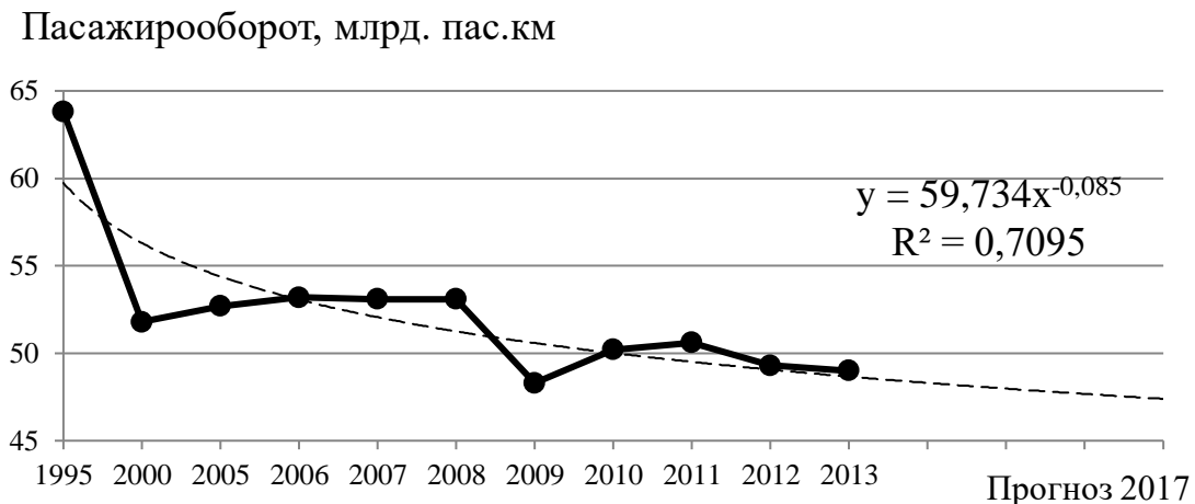
Рис. 4. Прогноз обсягу пасажирообороту залізничного транспорту

У ході дослідження розраховано прогностні значення розвитку залізничного транспорту України. Результати прогнозування обсягу пасажирообороту залізничного транспорту наведено на рис. 4.