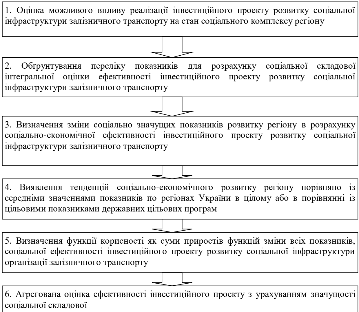
Рис. 5. Алгоритм комплексної оцінки ефективності інвестиційного проекту розвитку соціальної інфраструктури організацій залізничного транспорту

Пропонований алгоритм відрізняється простотою та дозволяє врахувати різний рівень та якість (транспортна доступність) життя населення в окремих регіонах України. Тому один і той же проект, реалізований у різних регіонах, буде мати різну значущість соціальної складової. Один і той же проект може бути прийнятий для одного регіону і відкинтий для іншого тільки через те, що населення, яке проживає в ньому, має низький рівень доходів.