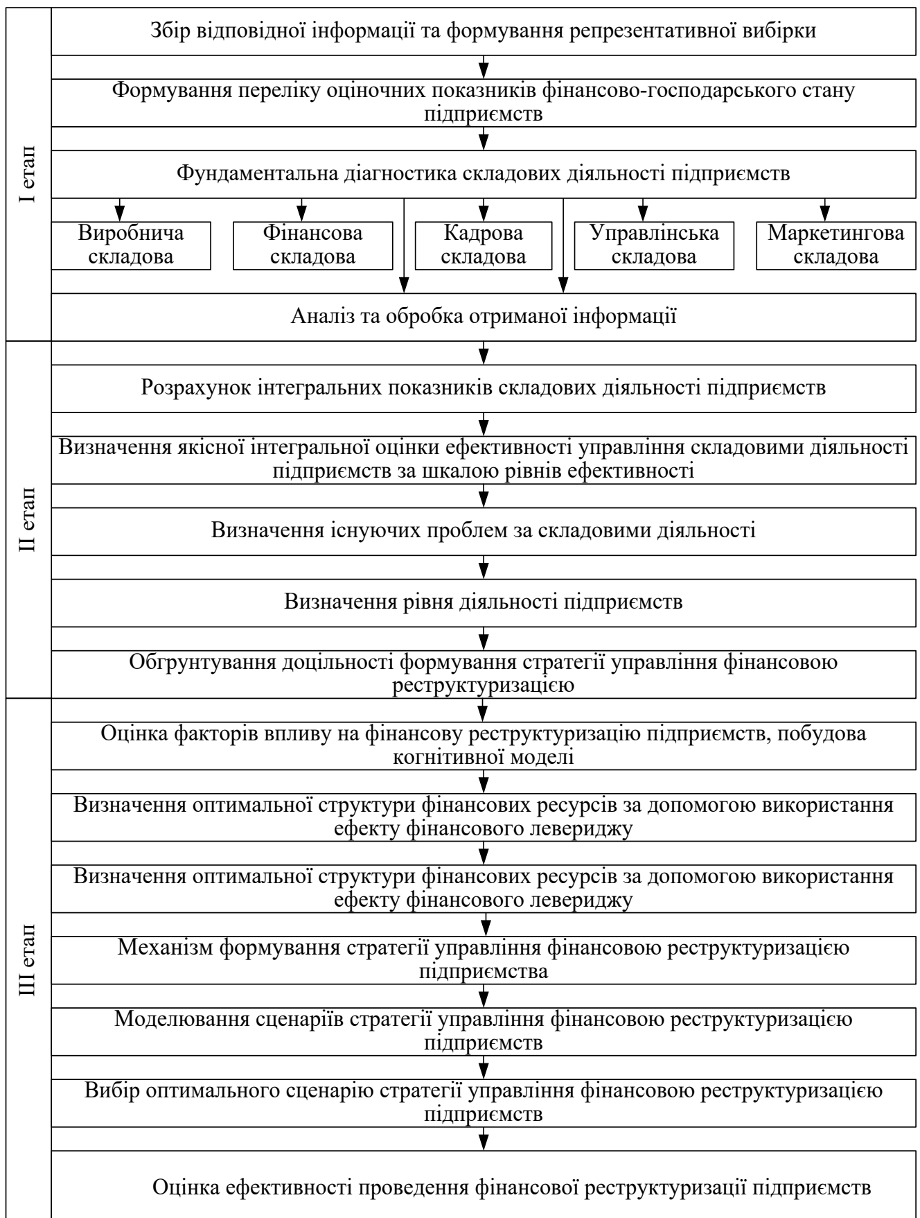
Рис. 2. Методичний підхід до оцінки ефективності проведення фінансової реструктуризації підприємств залізничного транспорту