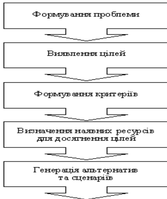
Рисунок 4.1 – Спрощена схема системного дослідження

Системне дослідження будь-якої проблеми починається з початкового формулювання та опису проблемної ситуації. Цей початковий етап зазвичай має наближений характер і може суттєво відрізнитися від робочої версії проблеми, яку формують у процесі аналізу. На ранньому етапі опис проблеми здійснюваний вербально і зазвичай має досить розпливчасту структуру [9].