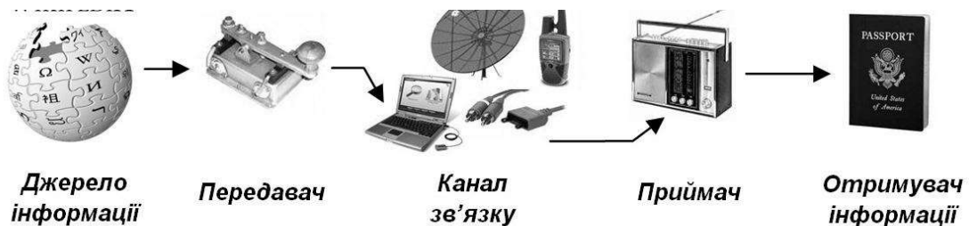
Рис.1. Схема процесу діджиталізації

Інформаційне суспільство завдячує своїй появі, власне, діджиталізації. Згідно Закону України «Про національну програму діджиталізації» діджиталізацією є сукупність взаємопов'язаних організаційних, правових, політичних, соціально-економічних, науково-технічних, виробничих процесів, направлених на створення умов для задоволення інформаційних громадських та суспільних потреб на підґрунті розробки, впровадження і застосування інформаційних систем, мереж, ресурсів та інформаційних технологій, побудованих внаслідок використання сучасної обчислювальної та комунікаційної техніки наведено на рисунку 1.