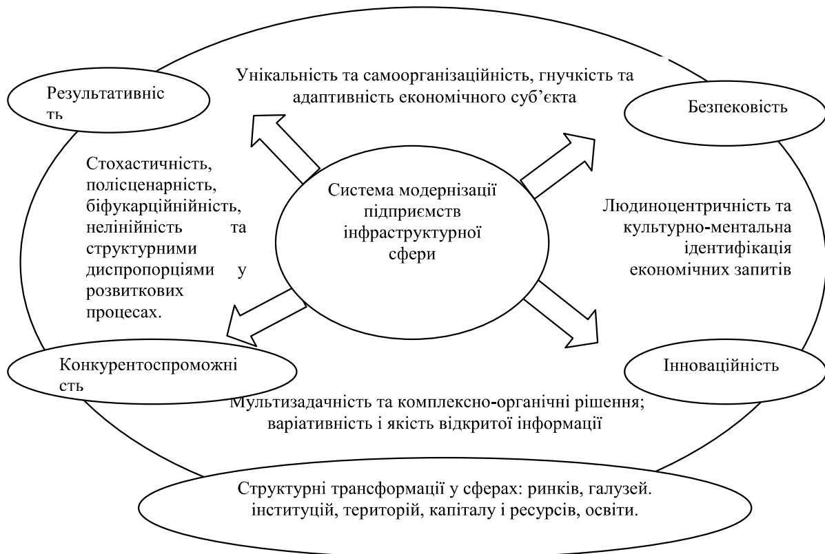
Рис.1. Контур закономірностей модернізації підприємств інфраструктурної сфери

перевезення вантажів із використанням книжки МДП 1975 р. (ЕЕК ООН)); несумісність національної нормативно-правової бази з міжнародним транспортним правом, зокрема в частині перетинання кордонів, організації перевезень і переробки вантажів на терміналах; – відсутність єдиної державної транзитної політики;