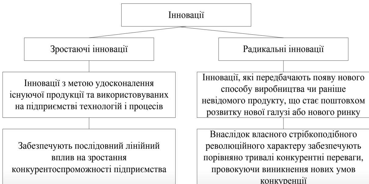
Рис. 1. Класифікація інновацій за результатами впливу на конкурентоспроможність суб'єкта господарювання

З огляду на важливість впливу інновацій на конкурентоспроможність суб'єкта господарювання, на нашу думку, доцільно виділити два укрупнених їх види: зростаючі інновації та радикальні інновації (рис. 1).