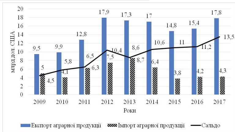
Рис. 2. Динаміка зовнішньої торгівлі України аграрною продукцією, млрд дол. США.