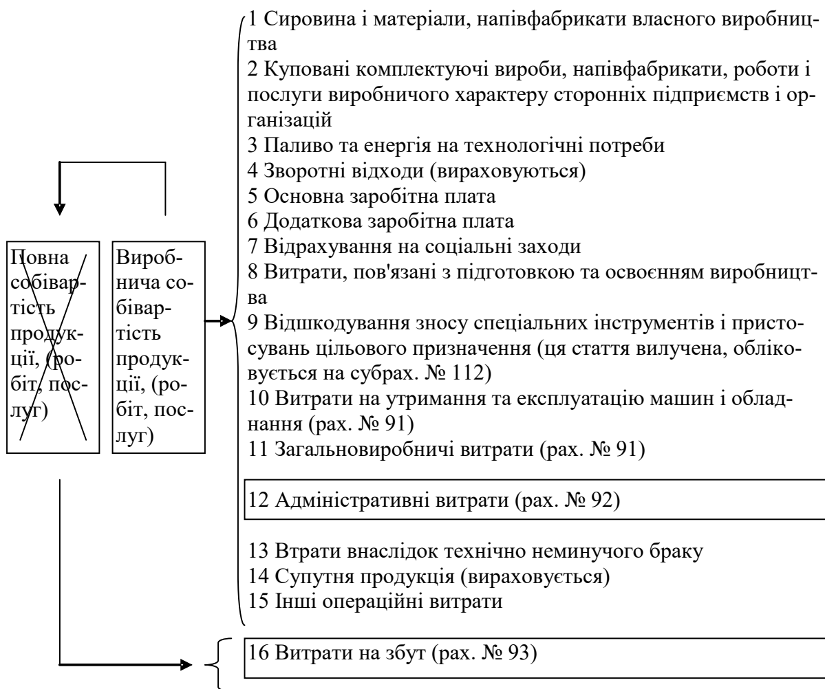
Рисунок 1.2 – Групування витрат за статтями калькуляції

При посиланнях на ілюстрації треба писати: «... згідно з рисунком 1.2» або використовувати інші вирази; слово «рисунок» пишеться повністю.