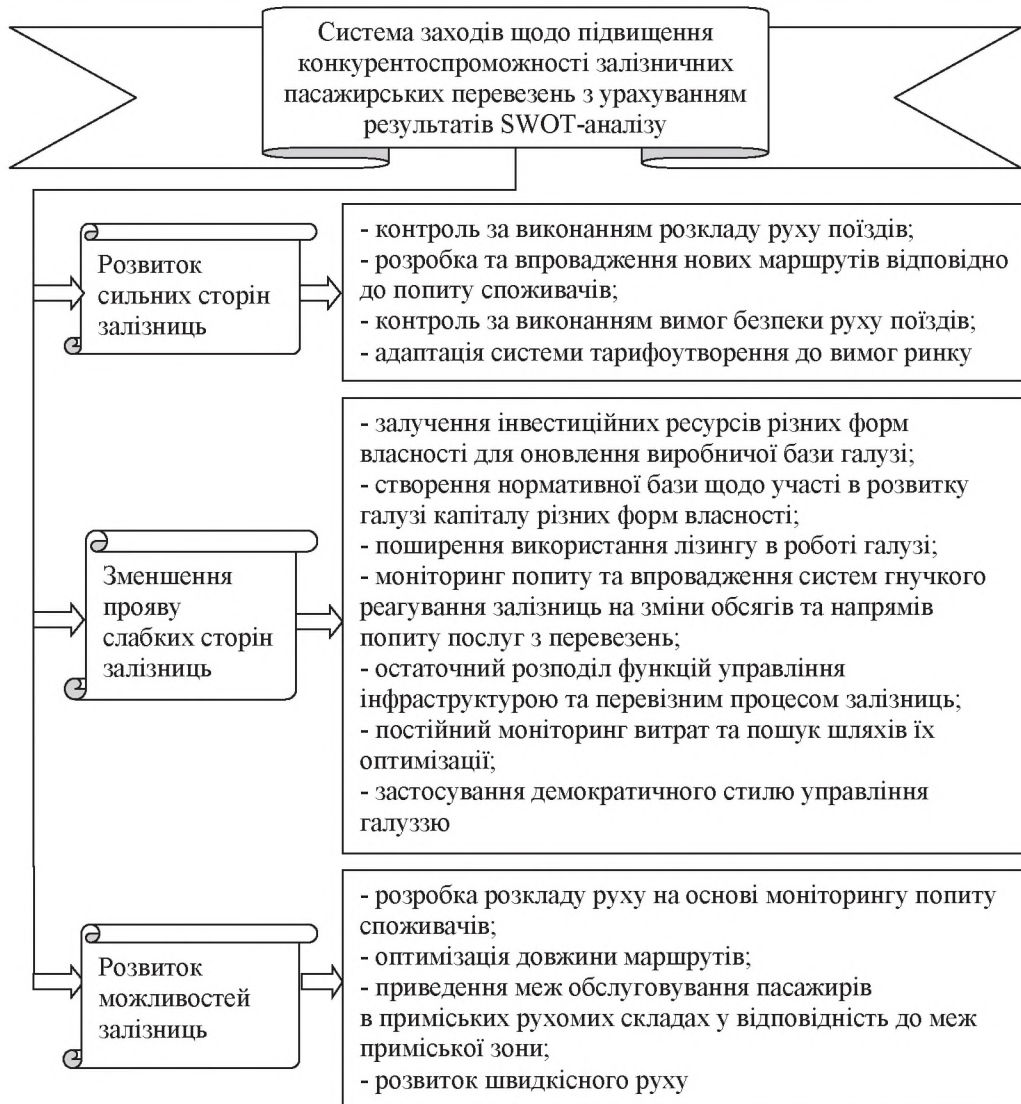
Рис. 3. Система заходів щодо підвищення конкурентоспроможності залізничних пасажирських перевезень з урахуванням результатів SWOT-аналізу

робка розкладу руху з урахуванням інтересів пасажирів, оптимізація маршрутів відповідно до пасажиропотоків та вимог споживачів, розвиток швидкісного руху тощо.