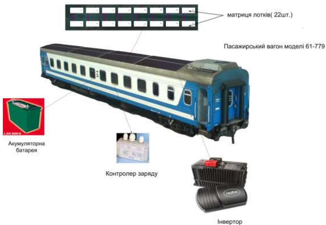
Рис. 2. Фотоелектрична система пасажирського вагона

Необхідно зазначити, що економіка України має відповідні потужності з виробництва необхідних компонентів та створення інфраструктури сонячної енергетики. Виробничі можливості тільки таких гігантів мікроелектроніки, як виробничі об'єднання «КВАЗАР», «РВА» (м. Київ), «Гравітон» (м. Чернівці), «Хартрон» (м. Харків), «Гамма» і «Електроавтоматика» (м. Запоріжжя), «Дніпро» (м. Херсон), «Позитрон» (м. Івано-Франківськ) дозволяють проводити повний технологічний цикл створення сонячних елементів. Україна має висококваліфікований науковий потенціал в цій галузі (Інститут фізики напівпровідників та Інститут електродинаміки НАНУ, Київський національний університет