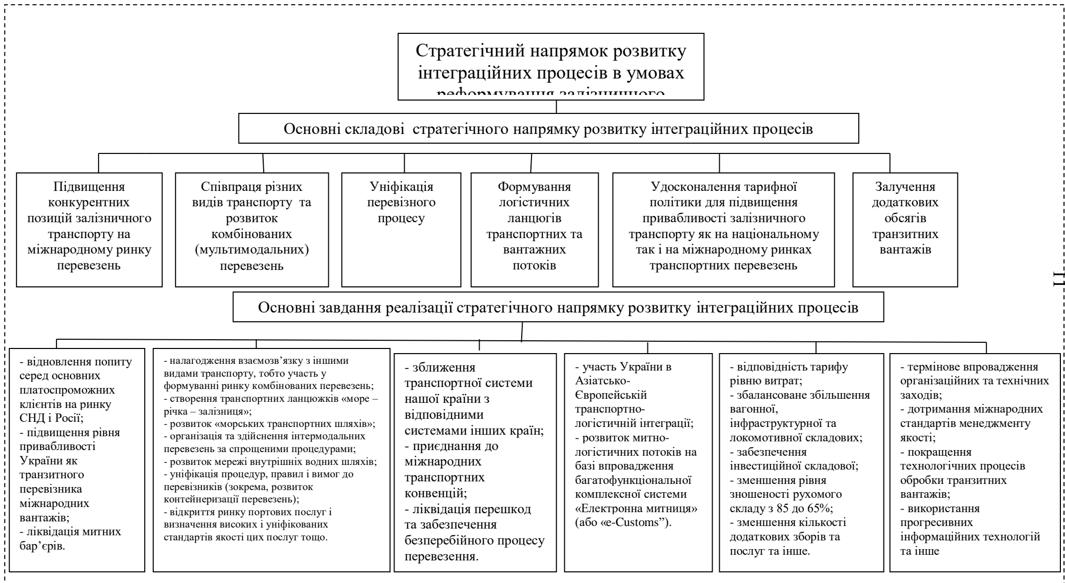
Рис. 3 Основні складові та завдання реалізації стратегічного напрямку розвитку інтеграційних процесів в умовах реформування залізничного транспорту України