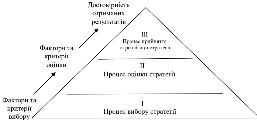
Рис. 1 Основні етапи розробки стратегії розвитку

Основними етапами розробки стратегії розвитку є процеси вибору, оцінки, а також прийняття та реалізації стратегії (рис. 1).