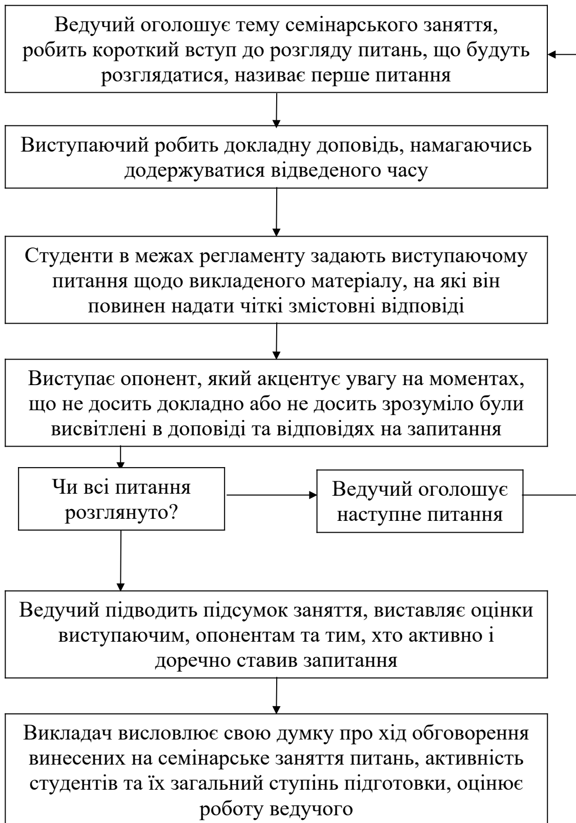
Рисунок 1 – Блок-схема проведення семінарського заняття в активній формі