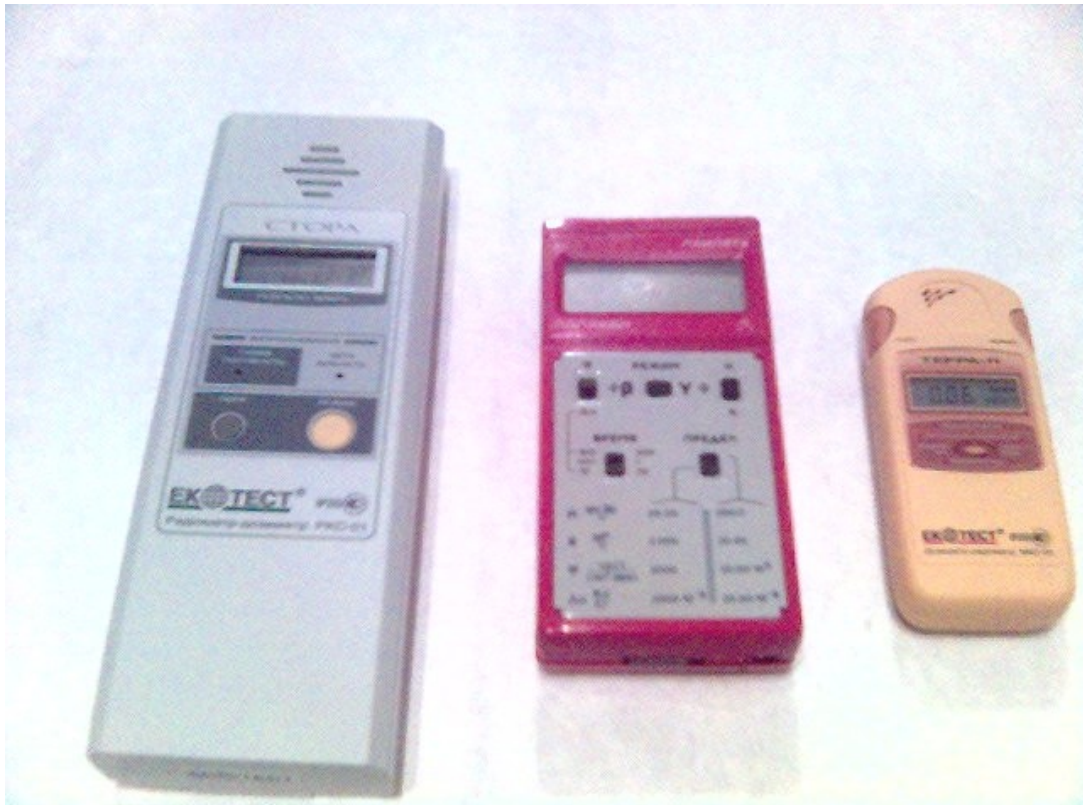
Рисунок 2.7 – Дозиметр-радіометр "Стора", "Прип'ять", МКС-05 "ТЕРРА-П"

Дозиметр-радіометр МКС-05 "ТЕРРА-П" проходить калібрування на еталонних джерелах іонізуючого випромінювання при випуску з виробництва і повірці не підлягає.