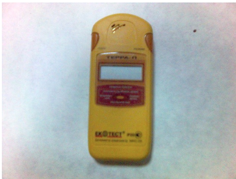
Рисунок 2.6 – Дозиметр-радіометр МКС-05 «ТЕРРА-П»

Дозиметр-радіометр МКС-05 "ТЕРРА-П" (рисунок 2.6) відноситься до класу побутових виробів і не є засобом для офіційних (професійних) вимірювань.