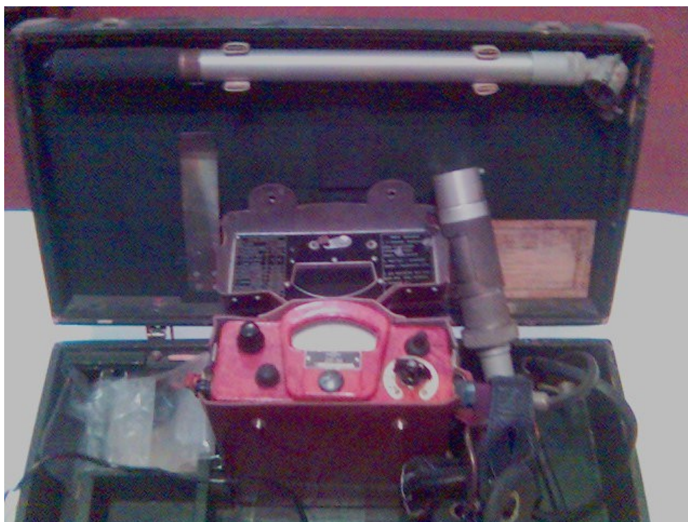
Рисунок 2.1 – Дозиметр потужності дози (рентгенметр) ДП-5В

Прилад забезпечує необхідні характеристики після однієї хвилини самопрогріву. Час установлення показань приладу, необхідний для гарантованої точності відліку, не перевищує 45 с.