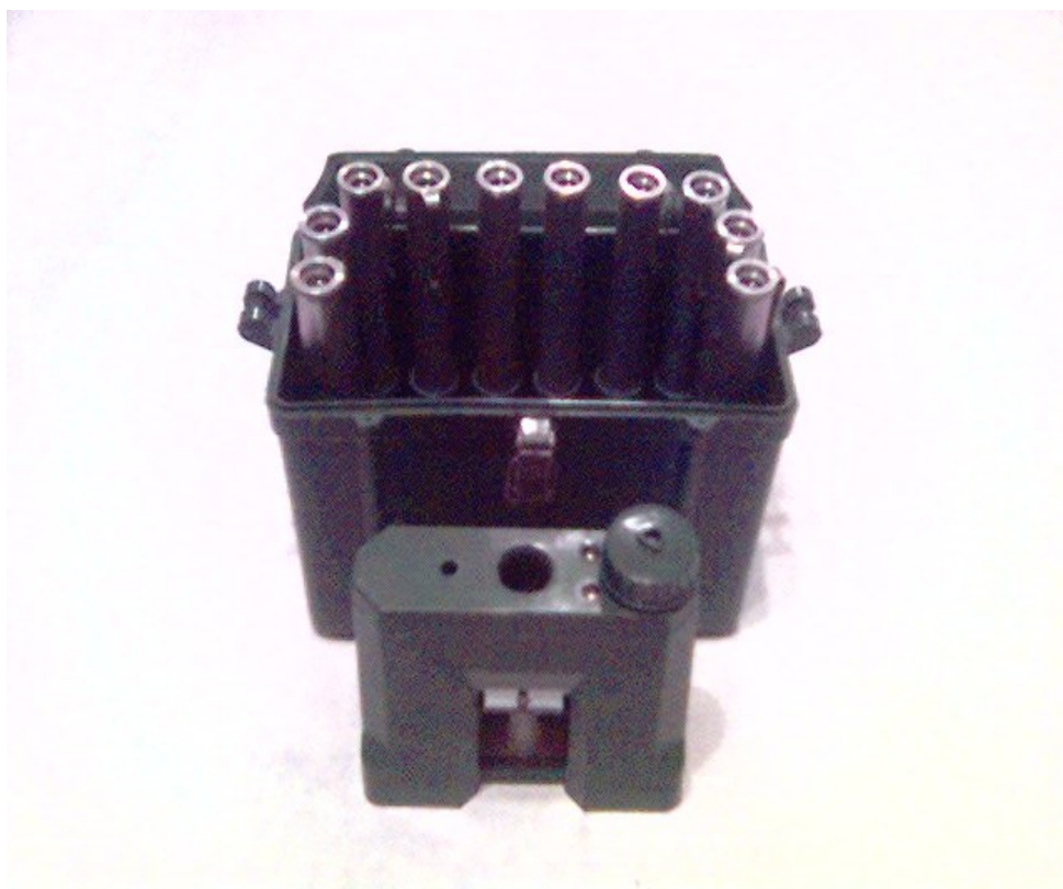
Рисунок 2.4 – Комплект індивідуальних дозиметрів ИД-1

індивідуальних дозиметрів ИД-1, зарядний пристрій ЗД-6, укладальна шухляда і технічна документація. Маса комплекту 2 кг, маса одного дозиметра 40 г.