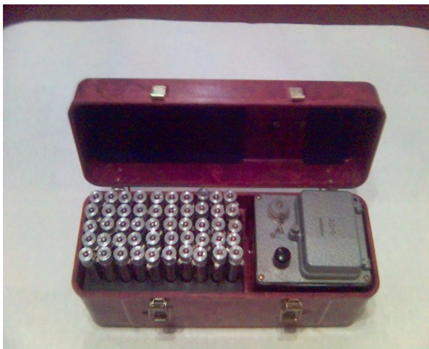
Рисунок 2.2 – Комплект індивідуальних дозиметрів ДП-22В

Комплекти індивідуальних дозиметрів ДП-22В і ДП-24 (рисунок 2.2) призначені для вимірювання експозиційної дози гамма-опромінення людей, що знаходилися на радіоактивно забрудненій місцевості. Якщо група людей виявиться в рівних умовах за радіоактивним опроміненням, то результати вимірювання дози опромінення одного з членів цієї групи можна віднести і до всієї групи.