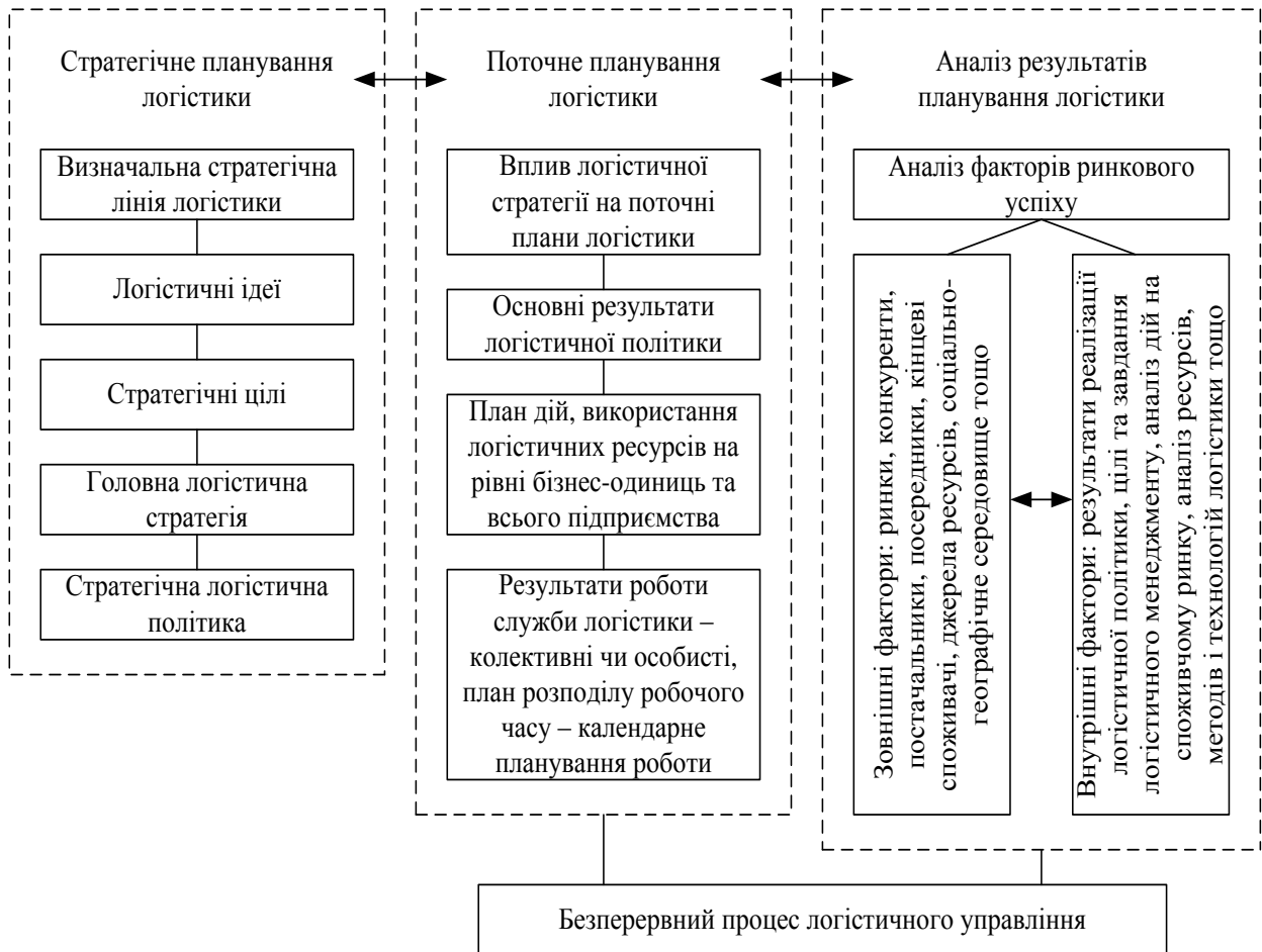
Рис. 1. Загальна схема планування логістики підприємства

Стратегічне планування логістики реалізується через: розподіл ресурсів; адаптацію до зовнішнього середовища; внутрішню координацію та організаційне