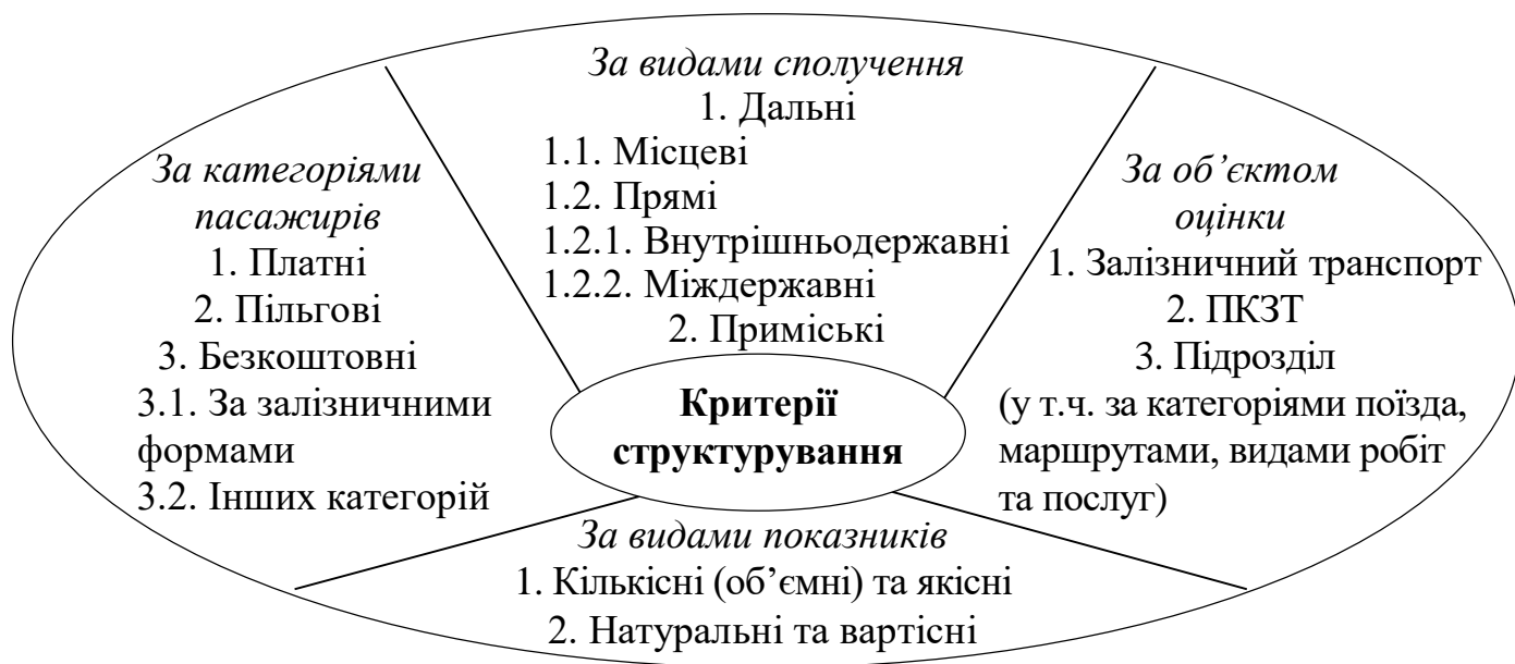
Рис. 4. Критерії структурування системи показників ефективності ПКЗТ

Запропонована сукупність показників містить більш детальну диференціацію за видами сполучення, у розрізі платних і безкоштовних перевезень, передбачає критерії, що дозволяють оцінити ефективність кожного поїзда, дозволяє дати не тільки загальну оцінку пасажирським перевезенням як кінцевої продукції залізничного транспорту, але й охарактеризувати ефективність роботи ПКЗТ окремо (рис. 4).