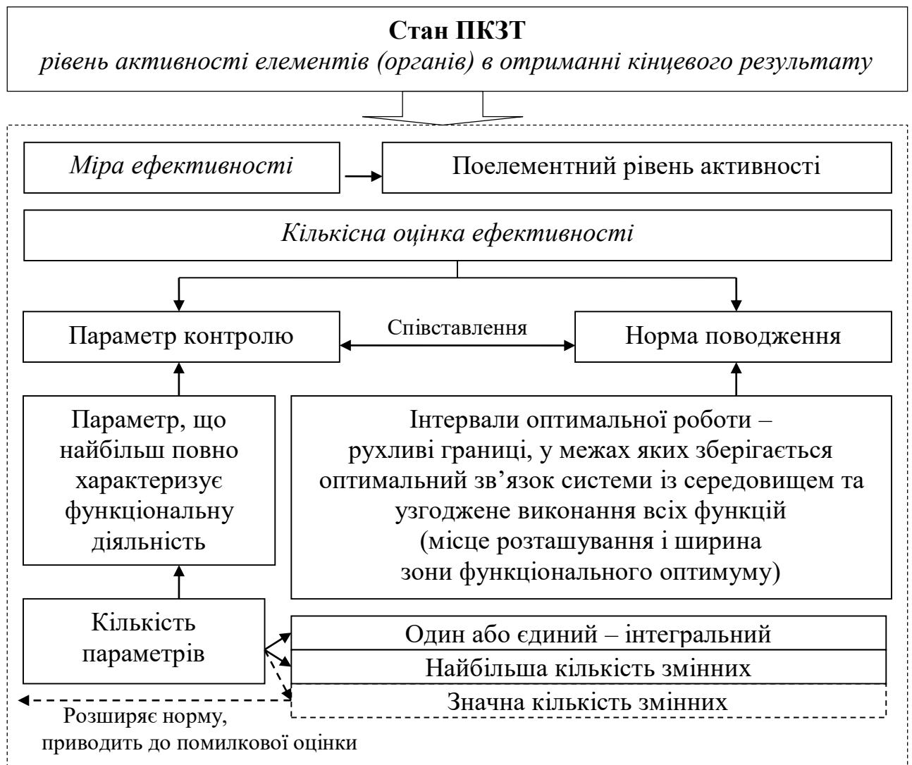
Рис. 3. Узагальнена схема моніторингу стану ПКЗТ

За методом статистичної закономірності стан ПКЗТ виражається рівнем активності елементів в отриманні кінцевого результату, який кількісно оцінюється при співставленні параметрів контролю з нормою поведження системи. Вихід фактичних значень економічних параметрів за межі функціонального оптимуму інтерпретується як зміна рівня ефективності (рис. 3).