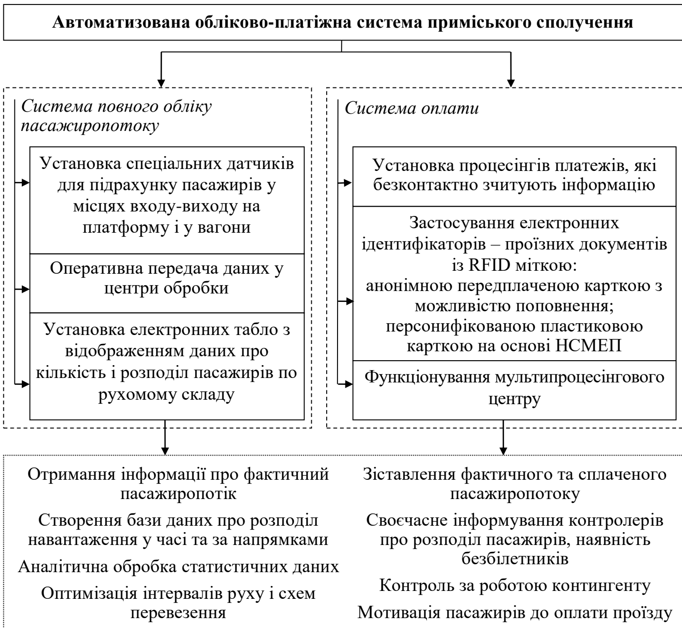
Рис. 1. Техніко-технологічне забезпечення і результативність автоматизованої обліково-платіжної системи приміського сполучення