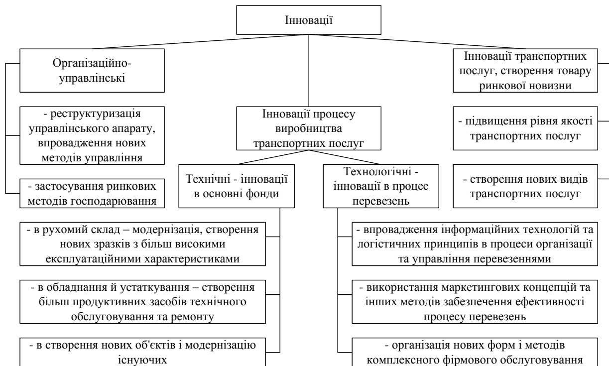
Рис. 1. Основні напрями інновацій на залізничному транспорті

Основні напрямки інновацій на залізничному транспорті наведені на рис.1.