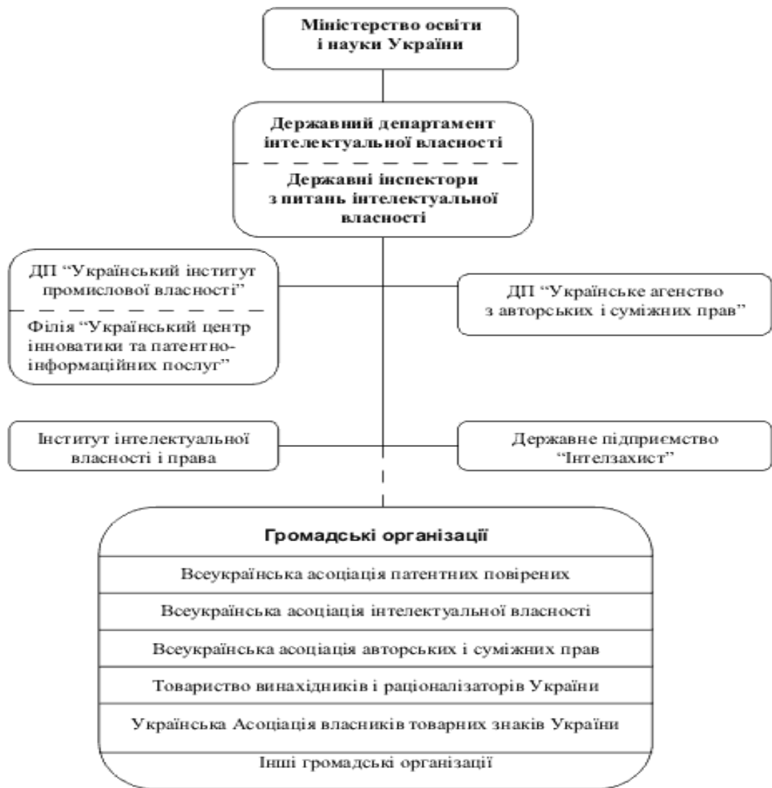
Рисунок 3.1 - Структура державної системи охорони інтелектуальної власності

За здійснення державної політики у сфері інтелектуальної власності в Україні відповідає Міністерство освіти і науки України. Виконання конкретних функцій у цій сфері воно делегувало Державному департаменту інтелектуальної власності. Держдепартамент є урядовим органом державного управління, що уповноважений реєструвати і забезпечувати підтримання на території України прав на винаходи, корисні моделі, промислові зразки, торговельні марки, зазначення походження товарів тощо, а також здійснювати реєстрацію об'єктів авторського права: творів науки, літератури, мистецтва, комп'ютерних програм, баз даних та інших творів. Держдепартамент проводить єдину державну політику у сфері правової охорони прав об'єктів інтелектуальної власності.