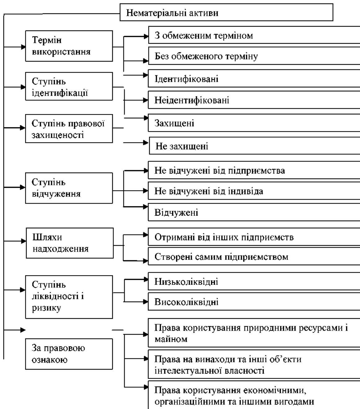
Рис. 2. Ознаки класифікації нематеріальних активів як економічної категорії