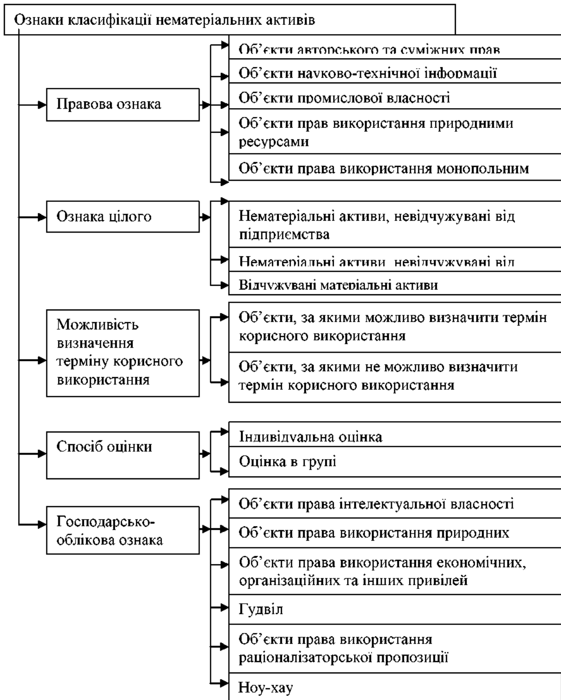
Рис. 1. Класифікація нематеріальних активів за Святоцьким Е., Гладуновим В., Бутнік-Сіверським А., Федченком Л.