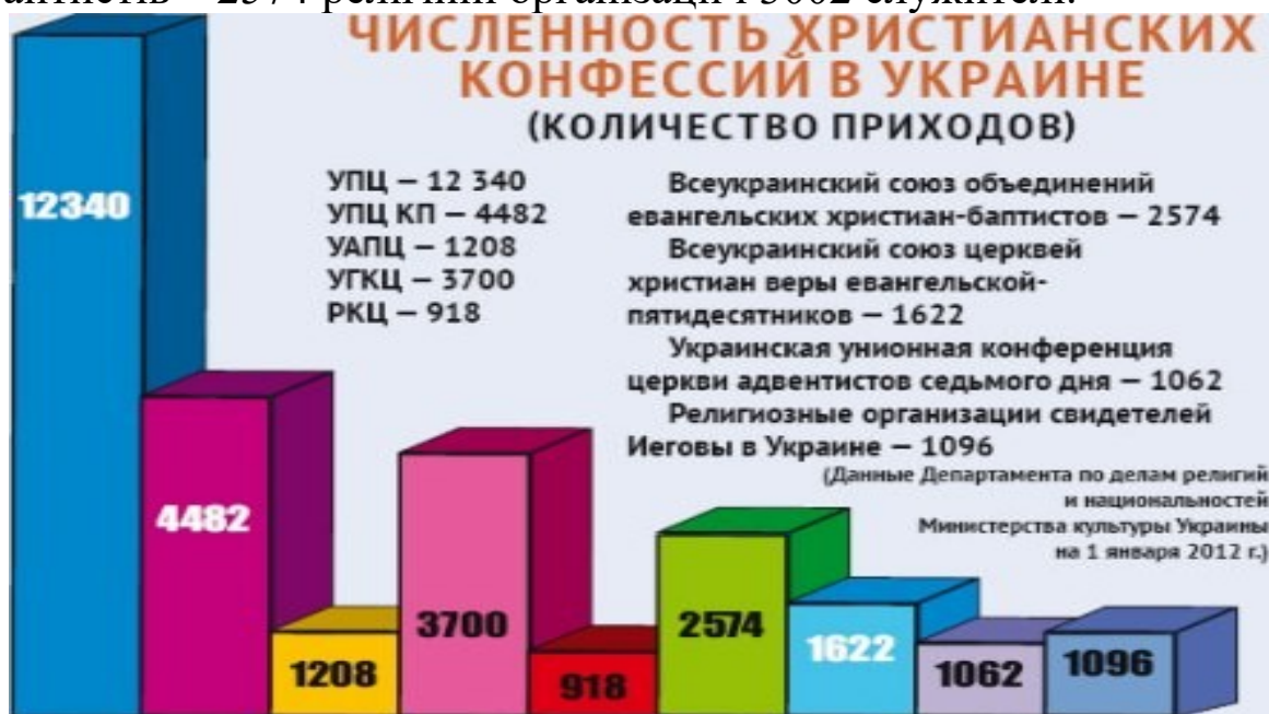
Рисунок 13 – «Чисельність християнських конфесій в Україні» [14.05.2012]

Серед протестантського напрямку найбільш чисельним є Всеукраїнський союз об'єднань євангельських християн-баптистів – 2574 релігійні організації і 3002 служителя.