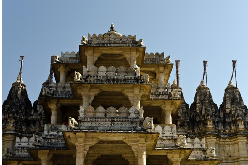
Рисунок 9 – Ранакпур – один з найвідоміших джайнських храмових комплексів Індії, збудований з білого мармуру. Ранакпур розташований в однойменному містечку в південній частині штату Раджастан у західній Індії

з душею, приковує людину до земних справ, визначаючи і її подальші переродження. Порятунку й вічного блаженства може досягти той, хто веде найбільш праведне життя. Від кожного потрібна віра в істинність вчення, основане на ньому дійсне знання й життя, тобто неухильне дотримання приписів релігії.