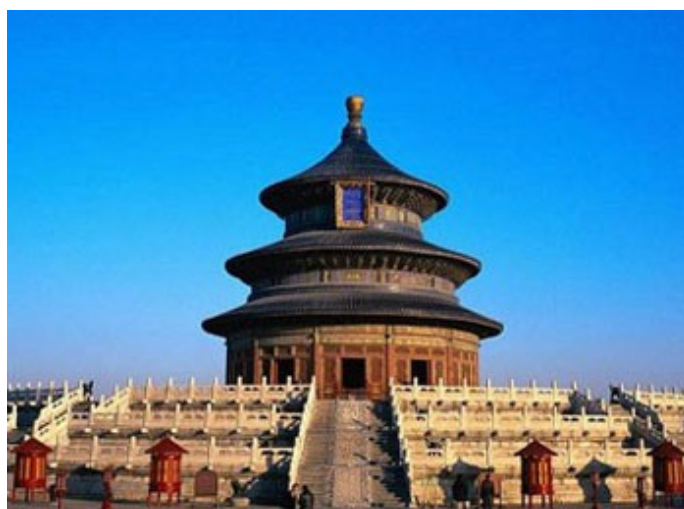
Рисунок 12 – Храм Неба – храмово-монастирський комплекс у центральному Пекіні

Даосизм – (кит. упр. 道教, Дао – Шлях речей) – одна з політеїстичних етнічних релігій Китаю. Він сформувався у II ст. н.е. на основі даосизму як одного з напрямів давньокитайської філософії, що виникли в IV-III ст. до н.е. Даосизм, що розділився на філософію (дао цзя) і релігію (дао цзяо), своїм джерелом має трактат Дао де дзін (Канон Дао й де), автором якого й відповідно засновником цього вчення традиційно вважають напівлегендарного давньокитайського мудреця Лао-Цзи (рисунок 12).