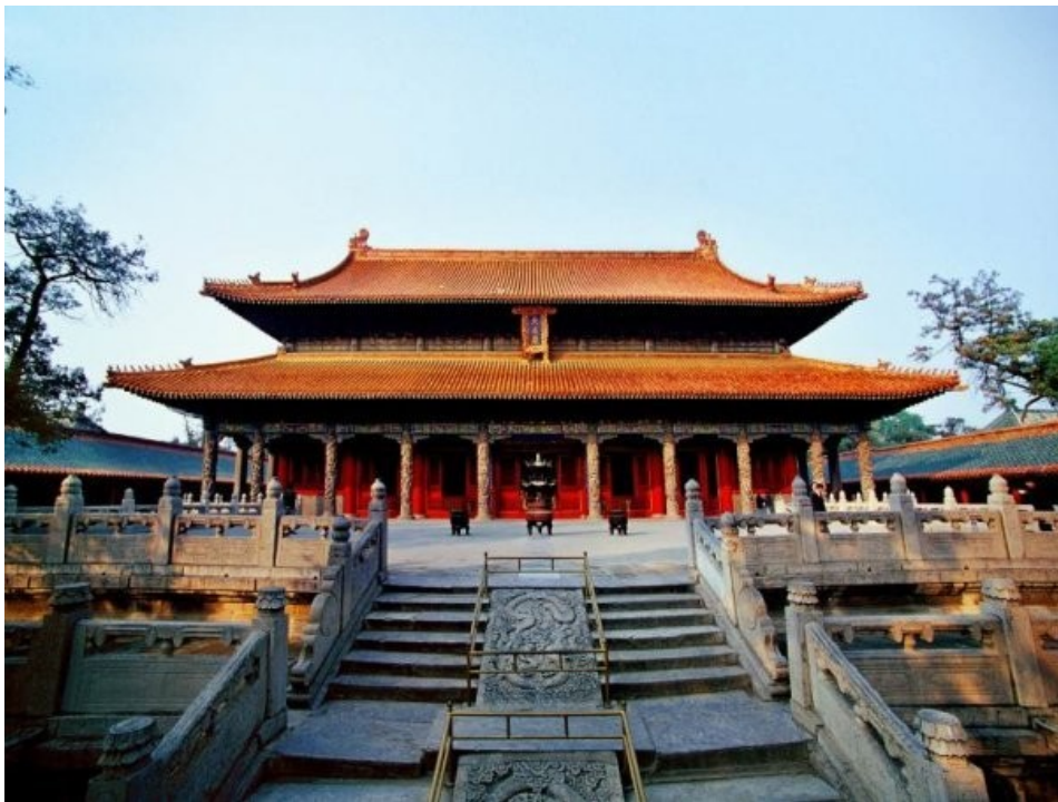
Рисунок 11 – Храм Конфуція в Пекіні – другий за розміром наявних у Китаї храмів, присвячених великому філософові Конфуцію

повинна дотримуватися «лі» — норм суспільного поведіння, традицій, обрядів, чинити відповідно до свого суспільного становища. Конфуціанство виправдовувало владу «шляхетних» над простим народом. З перетворенням конфуціанства на релігію Конфуцій був обожнений. Конфуціанство відрізняється від багатьох релігій відсутністю жрецтва, містичних елементів і зводиться до строгого виконання запропонованих обрядів. Основою, змістом культу конфуціанства є сформоване ще до Конфуція шанування предків: кожна сім'я, рід мають свій храм, де розміщені предки, що символізують таблички «чжу», перед якими розставляються жертвопринесення й відбуваються обряди. Конфуцій з його вченням про непорушну сталість порядків, поділ людей на нижчих і вищих з волі неба використовувався багатими станами Китаю для поневолення бідних і нижчих верств населення.