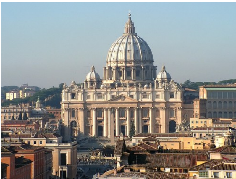
Рисунок 7 – Собор Святого Петра

працює близько 3 тис. службовців, в основному італійських священиків. Кількість підданих – близько 1 тис. осіб.