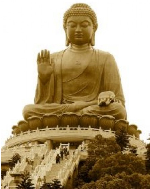
Рисунок 1 – Великий Будда

в) моральна проблематика в цих релігіях перебуває на першому плані, Бог перетворюється на сумління світу, на його моральний суд, а людина, щоб урятуватися, має здійснити моральний подвиг, зробивши вибір між добром і злом.