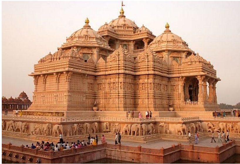
Рисунок 8 – Акшардхаам – індуїстський храмовий комплекс в м. Делі

найпоширеніших релігій сучасного світу, спадкоємець і продовжувач ідей ведичної релігії й брахманізму, в Індії позначається зазвичай терміном «хінду дхарма», тобто закон індусів. Сформувався до середини 1 тис. н.е. На рисунку 8 зображено Акшардхаам – індуїстський храмовий комплекс в м. Делі, ввійшов до Книги Рекордів Гіннеса як найграндіозніший індуїстський храм у світі, відкриття храму відбулося у 2005 р.