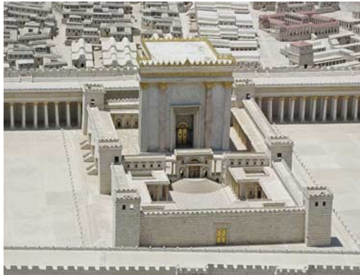
Рисунок 10 – Ієрусалимський Храм – культова споруда, яка стала центром релігійного життя єврейського народу між X ст. до н. е. і I ст. н. е.

Іудаїзм – (давньогрецьк.), «іудейська релігія» (від назви коліна Іуди, що дало назву Іудейському царству, а потім стало загальною назвою єврейського народу – івр. יהודה) – це монотеїстична етнодержавна релігія, яку сповідують євреї різних країн. Джерела іудаїзму сягають релігії євреїв-кочівників Аравії 2 тис. до н.е., куди вони прийшли із Центральної Азії. Серед них поширювалися культу духів предків, тварин, явищ природи. Політеїстичні вірування й обряди кочових єврейських племен біблійного періоду іудаїзму (2 тис. до н.е.) в результаті повернення-завоювання ними в XIII ст. до н.е. Палестини доповнилися релігійними уявленнями місцевих землеробських народів (рисунок 10).