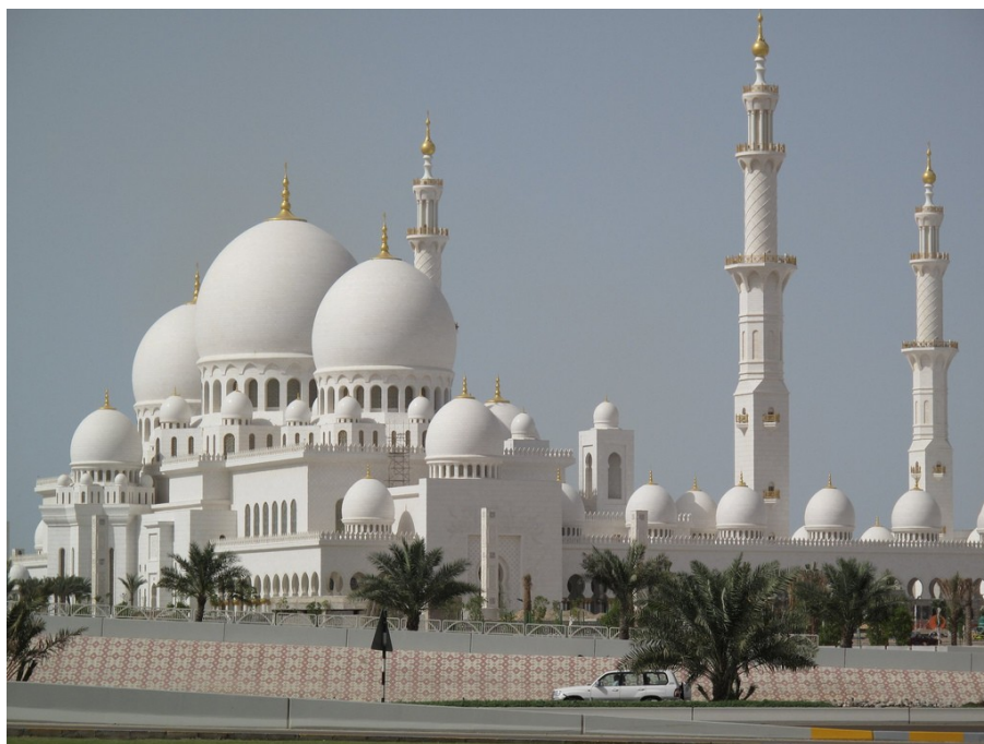
Рисунок 4 – Мечеть шейха Зайєда

На рисунку 4 зображено Мечеть шейха Зайєда – третю за величиною мечеть у світі, що розташована в Абу-Дабі, столиці Об'єднаних Арабських Еміратів. Уже в перше століття свого існування іслам у процесі військової експансії арабів поширився на величезній території від Ганга на Сході до південних меж Галлії на Заході, у результаті чого утворилася мусульманська держава Халіфат. Число послідовників ісламу перевищило 1 млрд осіб. Він підрозділяється на дві течії: суннізм , у якого 940 млн послідовників, і шиїзм — 120 млн adeptів.