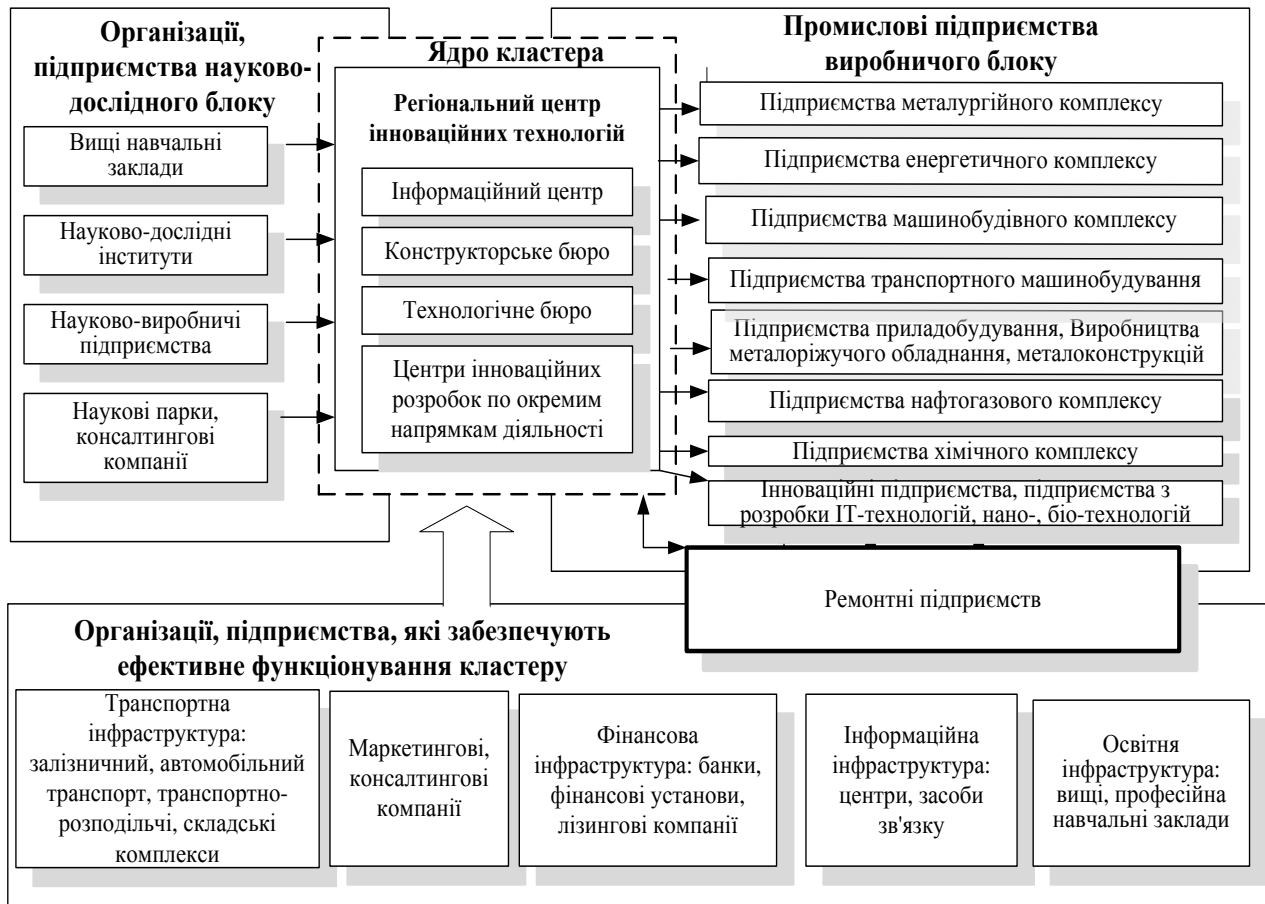
Рис. 2. Промислово-територіальний кластер

Слід зазначити, що основою техніко-економічного відставання сучасних промислових підприємств є високий рівень морального та фізичного зносу техніко-технологічної бази підприємств, висока енергоємність виробництва, обмеженість власних енергетичних ресурсів, відсутність ефективної системи збагачення низькоякісної вітчизняної сировини. На початкових стадіях інтегрування в промислово-територіальні кластер сучасним промисловим підприємствам буде складно перейти на виробництво інноваційного продукту.