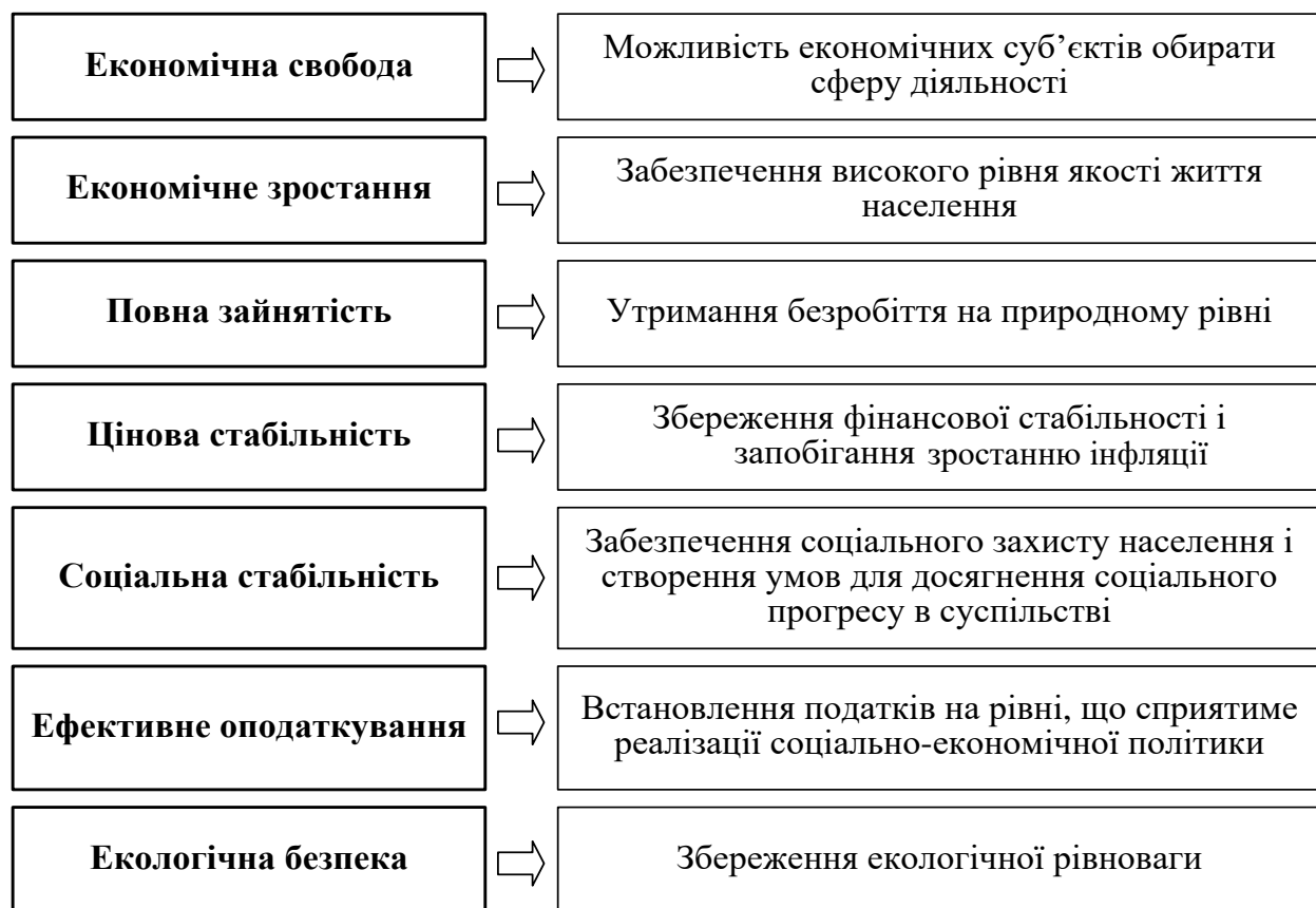
Рисунок 1.1 – Напрями та цілі соціально-економічної політики держави [18]

Основними напрямками соціально-економічної політики провідних країн світу є: економічна свобода; економічне зростання; повна зайнятість; цінова стабільність, соціальна стабільність, ефективне оподаткування, економічна безпека (рисунок 1.1) [18].