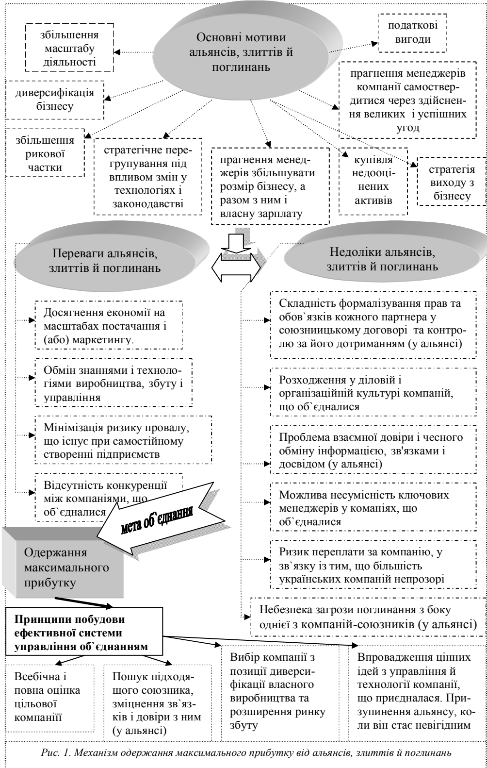
Рис. 1. Механізм одержання максимального прибутку від альянсів, злиттів й поглинань

досліджено наступний механізм отримання максимальної вигоди від альянсів, злиттів й поглинань, виходячи з основних мотивів злиттів і поглинань, їх основних переваг і недоліків (рис.1).