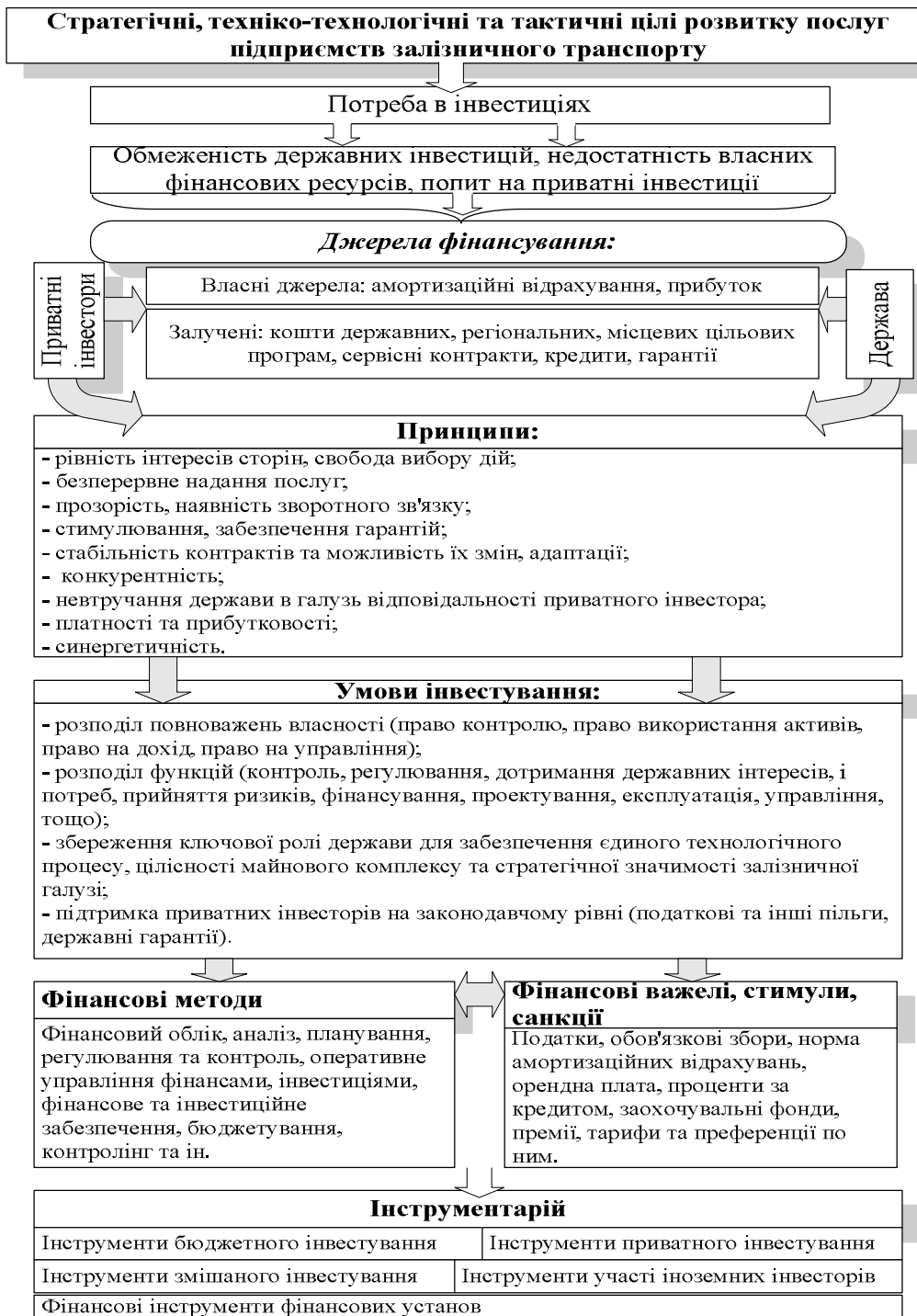
Рис. 1 Патренський підхід до формування фінансового механізму управління розвитком послуг підприємств залізничного транспорту

Ключовою умовою формування організаційно-економічного механізму розвитку послуг підприємств залізничного транспорту є належний рівень нормативно-правового, адміністративно-організаційного та інформаційного забезпечення розвитку послуг.