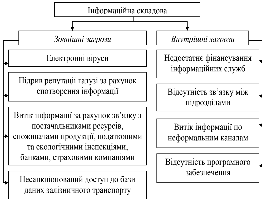
Рис. 1 Види загрози інформаційної складової економічної безпеки залізничного транспорту

Для вилучення необхідної інформації використовуються як легальні (використання експертів), напівлегальні (бесіди зі спеціалістами, неправдиві конкурси та найми, запрошення консультантів, переманювання спеціалістів, використання жіночої краси), так і нелегальні методи (викрадення або копіювання документів, підслуховування, проникнення в комп'ютерну мережу, викрадення власності).