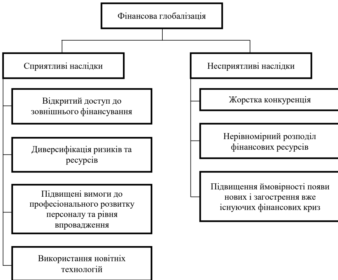
Рис. 2. Наслідки фінансової глобалізації