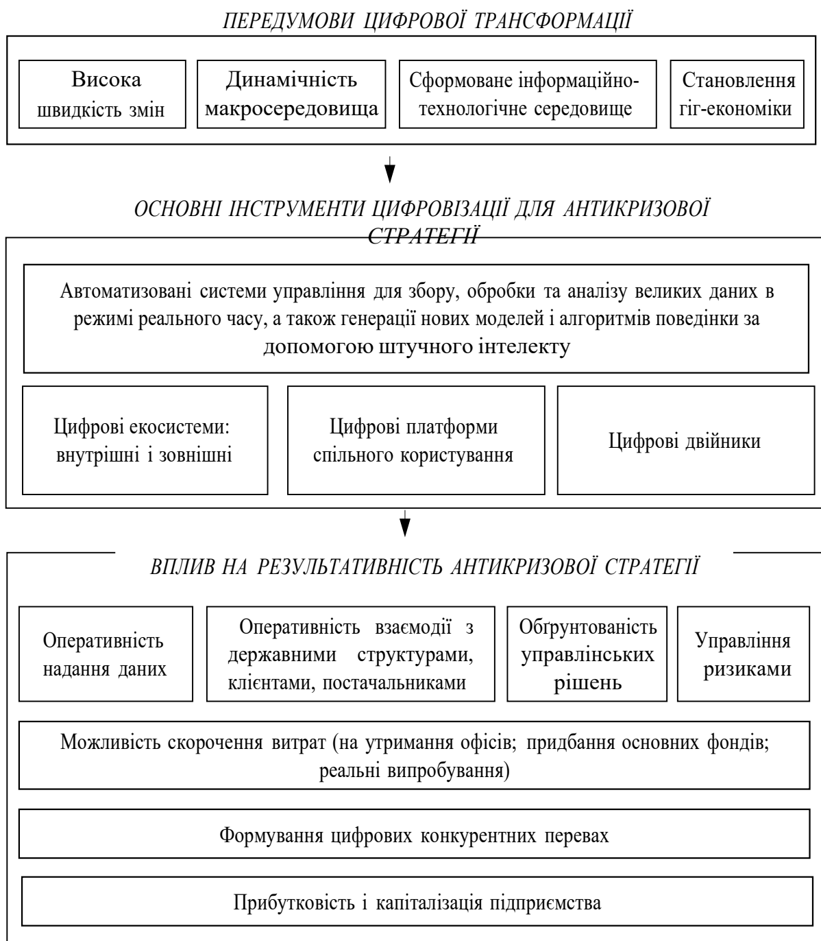
Рис. 2. Вплив цифровізації на розроблення антикризової стратегії підприємства (авторська розробка)

алгоритми і моделі для вирішення конкретних завдань. – алгоритмічні моделі довіри (забезпечують конфіденційність даних); – посткремнієві обчислення (розвиток нових передових матеріалів з розширеними можливостями для зберігання і обробки даних, обчислень); – формативний штучний інтелект, здатний трансформуватися під впливом зовнішніх умов і генерувати нові алгоритми і моделі для вирішення конкретних завдань. Розвиток штучного інтелекту, аналітики великих даних і машинного навчання відкриває сьогодні нові можливості для антикризового управління. Дане твердження пояснюється тим, що процес антикризового управління підприємством потребує прийняття складних управлінських рішень щодо