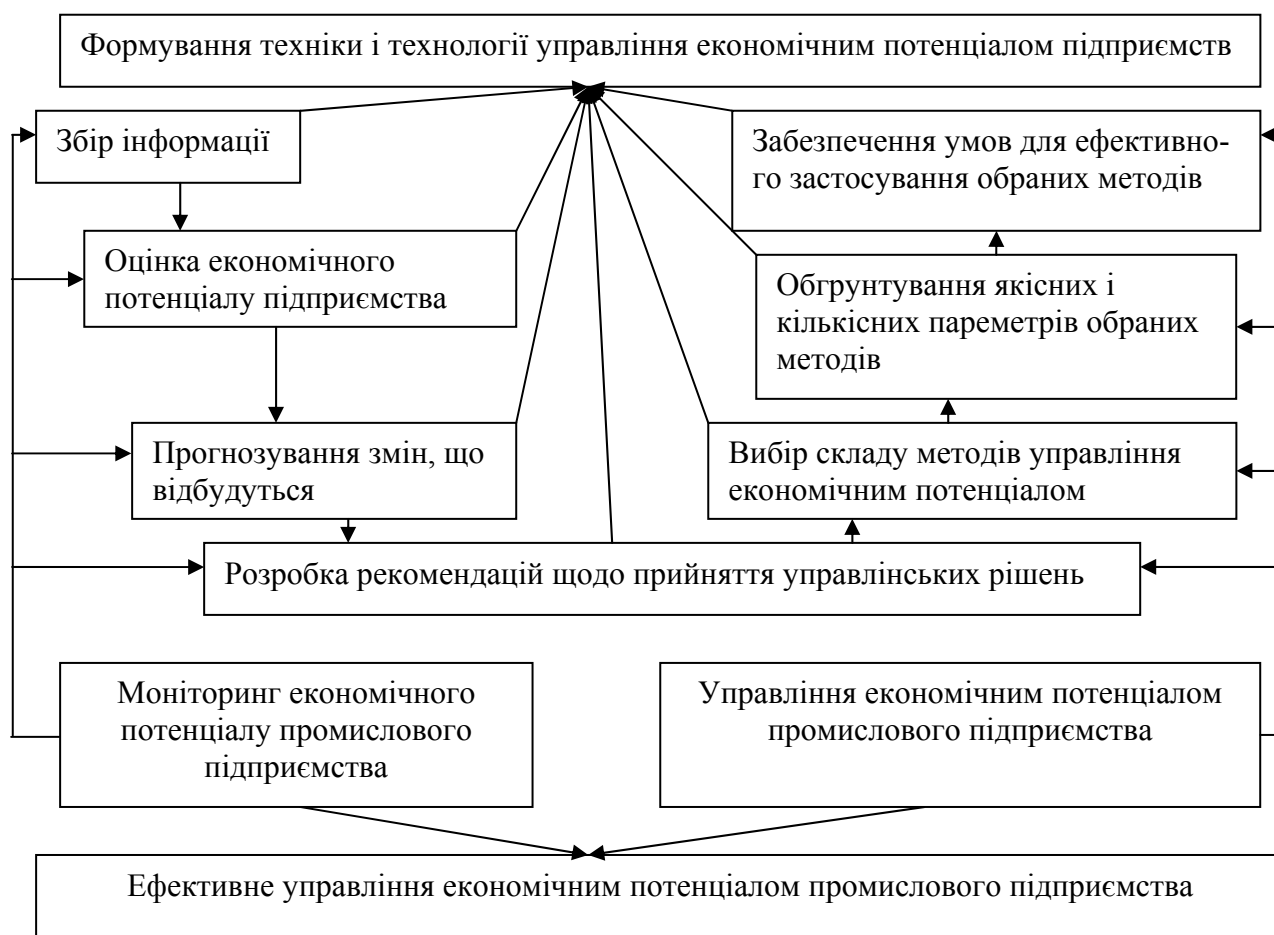
Рисунок 3 -Схема ефективно управління економічним потенціалом промислового підприємства

конкретних способів впливу на людей; соціальне регулювання або розв'язання виявлених проблем і реалізацію визначених способів впливу на людей. Психологічні методи використовуються з метою гармонізації взаємовідносин працівників підприємства і встановлення найбільш сприятливого психологічного клімату. До них належать: гуманізація праці (ліквідація монотонності, колірне забарвлення приміщень і устаткування, використання спеціально підібраної музики); психологічне спонукання (заохочення творчості, ініціативи і самостійності); задоволення професійних інтересів, підвищення творчого змісту праці; розробка мети за психологічними характеристиками і розвиток необхідних психологічних рис; комплектування малих груп за критерієм психологічної сумісності працівників; встановлення нормальних взаємовідносин між керівниками і підлеглими.